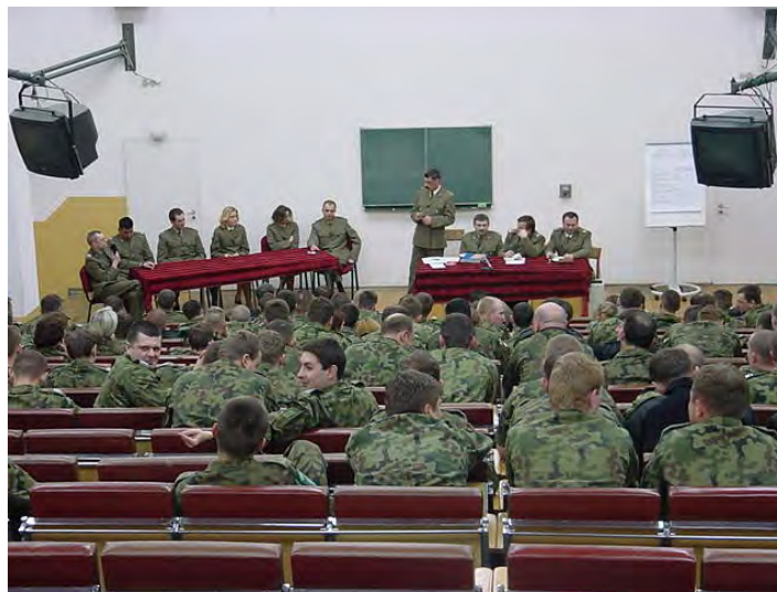
Olimpiada wiedzy granicznej

W celu popularyzacji wiedzy i umiejętności z zakresu ochrony granicy państwowej od 2000 roku w naszej szkole realizowana jest pod patronatem komendanta głównego SG Olimpiada Wiedzy Granicznej, która obejmuje wszystkich słuchaczy.