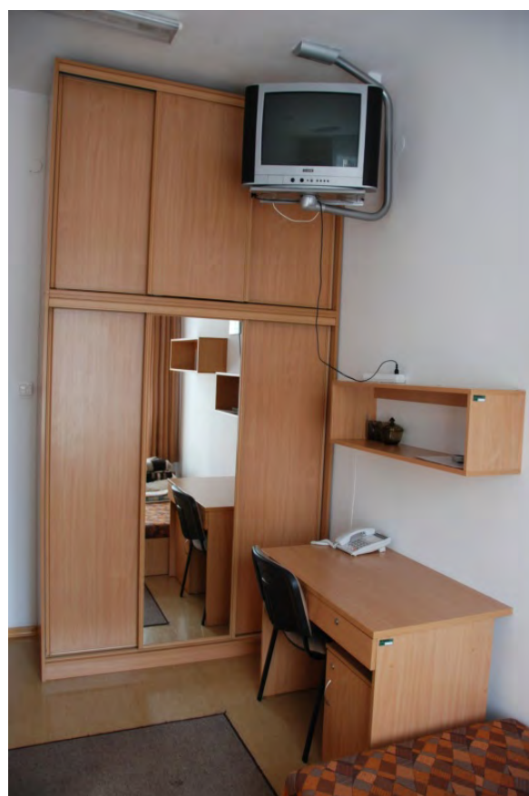
Wyremontowane pomieszczenia w internacie w bloku nr 4