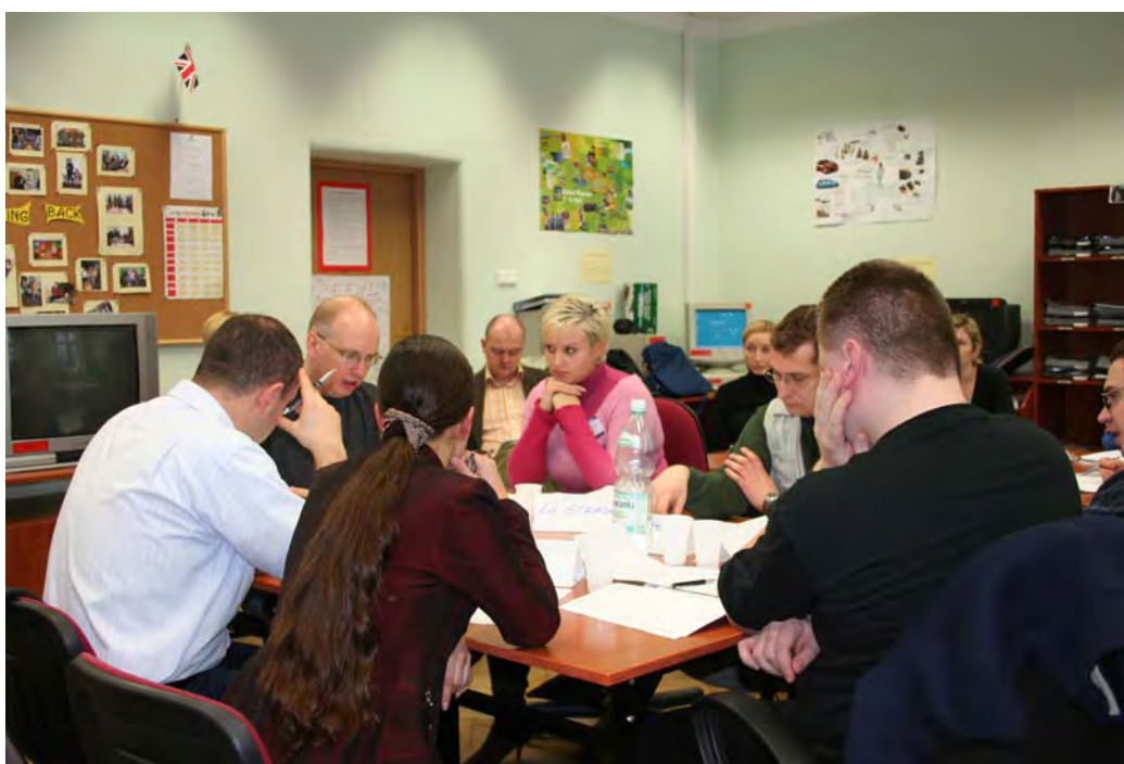
Międzynarodowy kurs języka angielskiego Integrated Training for Peace Support and Security Management (ITPSSM) (2008 r.)