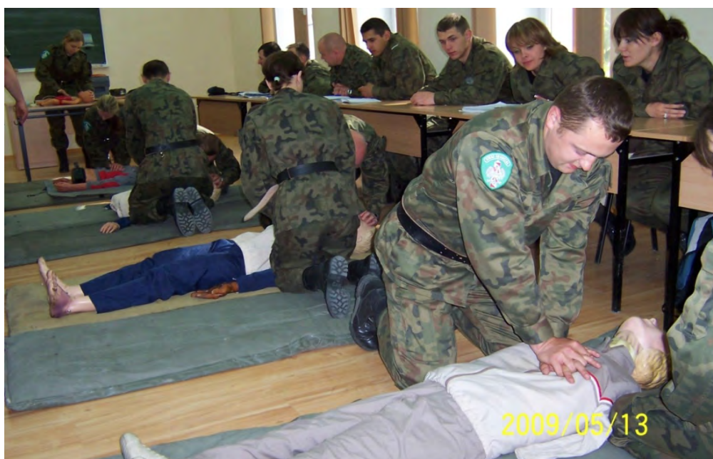
Zajęcia z przedmiotu BHP ze słuchaczami Szkolenia Podstawowego

Współczesny rynek usług to informacja szybko dostarczona do adresata. Zatem sprawne, sprawdzone środki łączności oraz umiejętne ich wykorzystanie może stanowić o powodzeniu wielu zaplanowanych przedsięwzięć. W warunkach służby granicznej należy do tego katalogu dodać także sytuacje nagłe, niespodziewane i związane bezpośrednio z koniecznością podejmowania działań na rzecz zapewnienia bezpieczeń-