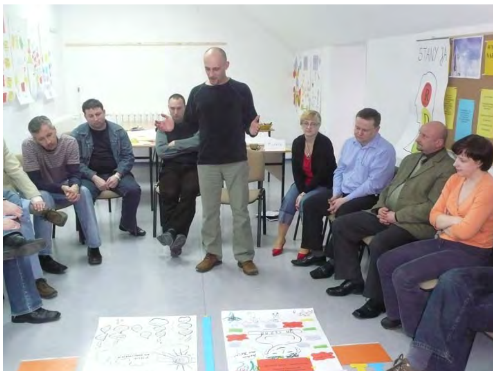
Trening Rozwoju Umiejętności Społecznych (2008 r.)

zadań i obowiązków służbowych. Dotychczas realizowany był moduł podstawowy TRUS-P. Trenerzy TRUS z CS SG, przeszkoleni przez kolegów z Policji niemieckiej, pomagają uczestnikom otworzyć się na kreatywny styl pracy, poznać mechanizmy własnych działań w relacji z innymi ludźmi, zmienić podejście i nastawienie do wykonywania obowiązków służbowych oraz kreować pozytywny wizerunek profesjonalnie działających służb mundurowych.