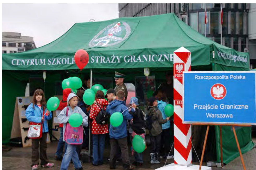
16 czerwca 2009 Warszawa – festyn „Bezpieczne wakacje”

Od kilku lat we współdziałaniu z Gabinetem Komendanta Głównego SG, Policją i Państwową Strażą Pożarną organizowane są przedsięwzięcia informacyjno-profilaktyczne: „Razem bezpieczniej”, „Bezpieczne miasto”, „Bądź bezpieczny w mieście ze Strażą Graniczną”, „Bezpieczne wakacje” (organizowane pod patronatem i z udziałem Szefa Biura Bezpieczeństwa Narodowego).