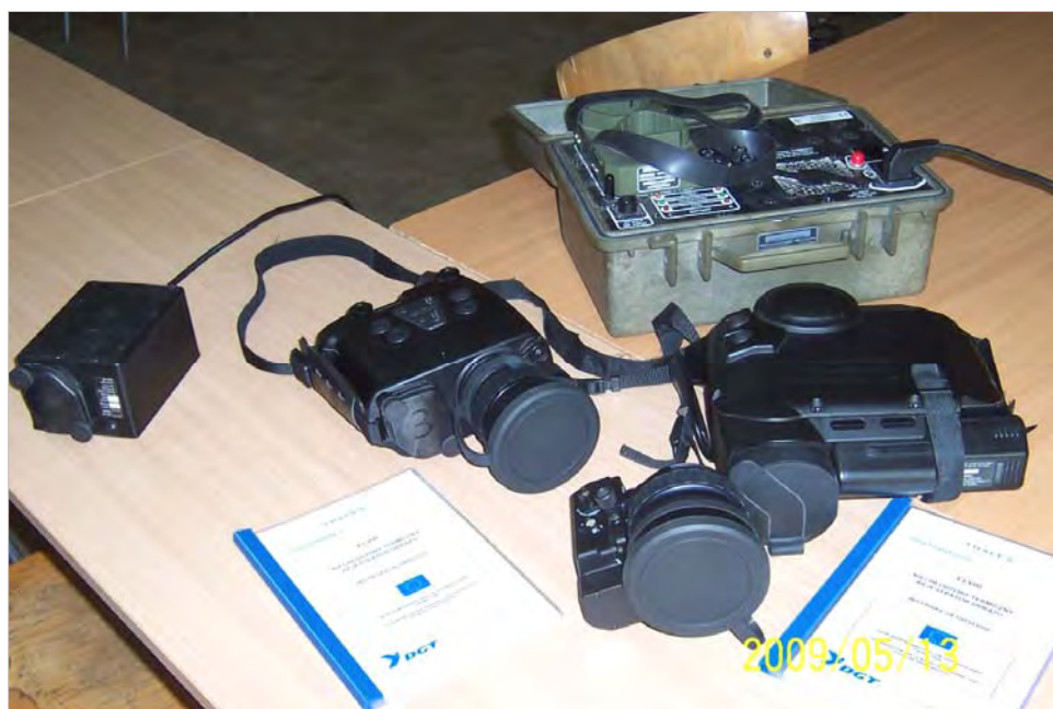
Zestaw ręcznych kamer termowizyjnych