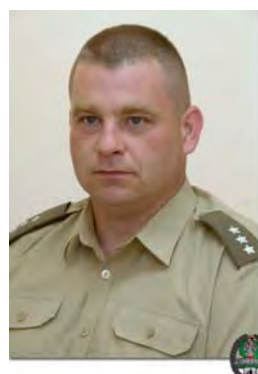
por SG Jacek Ciunel