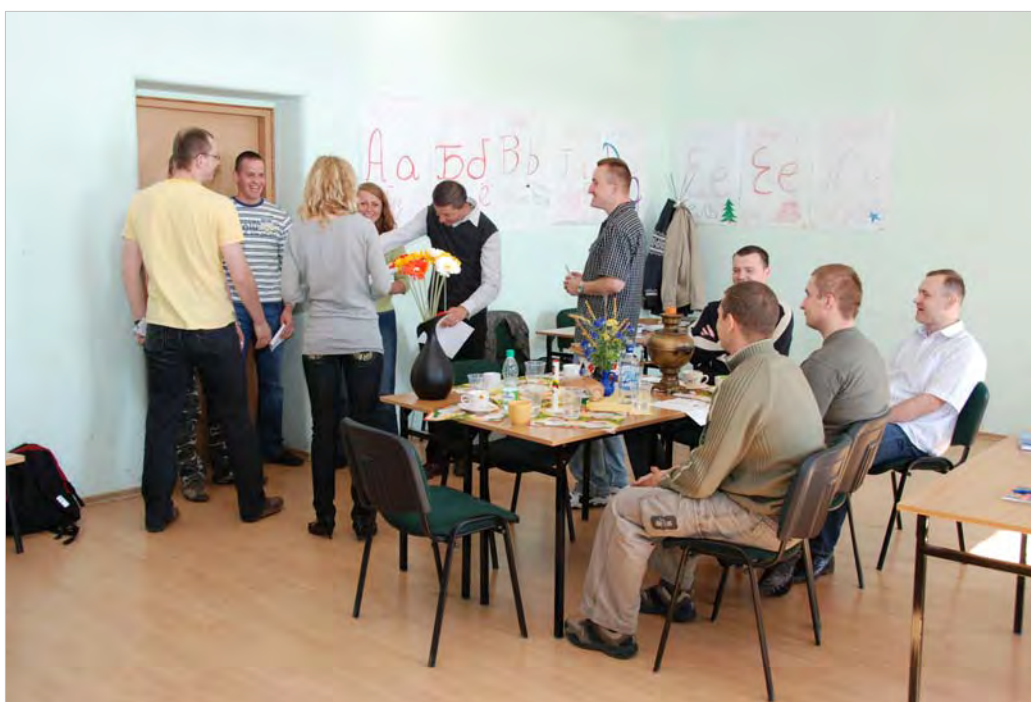
Modułowy kurs jęz. rosyjskiego, poziom A1 – przedstawienie nt. „Tradycje rosyjskie – w gościach” (2009 r.)

Należy podkreślić, że wszystkie szkolenia cieszą się ogromnym zainteresowaniem i są bardzo wysoko oceniane przez uczestników. Planowane są kolejne edycje ww. kursów doskonalących.