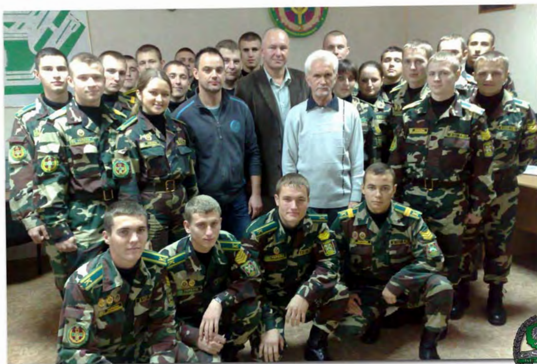
Przedstawiciele PSGU podczas szkolenia z wykładowcami CS SG

Przedstawiciele Zakładu realizowali wyjazdowe szkolenia międzynarodowe na Litwie, Łotwie oraz Ukrainie z zakresu kryminalistyki. Wzięli w nich udział funkcjonariusze litewskiej i łotewskiej Straży Granicznej oraz żołnierze Państwowej Służby Granicznej Ukrainy.