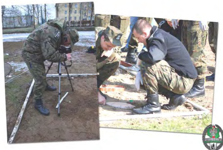
Zajęcia z kryminalistyki

Oprócz szkoleń kwalifikowanych na poziomach podstawowym, podoficerskim, chorążych i oficerskim realizuje całą gamę szkoleń i kursów doskonalących w ramach doskonalenia zawodowego funkcjonariuszy SG. Problematyka szkoleń kwalifikowanych obejmuje kluczowe zagadnienia kryminalistyki, jakie mogą być przydatne podczas realizacji czynności służbowych przez funkcjonariuszy. Dominują tu: ślady kryminalistyczne, portret pamięciowy, system zabezpieczeń oraz fałszerstwa dokumentów, a także daktyloskopowanie osób.