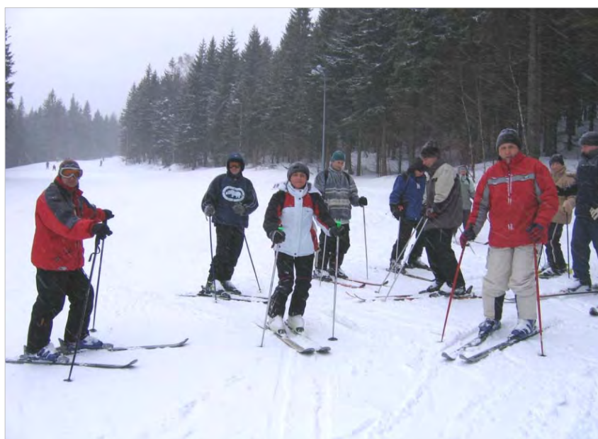
Słuchacze podczas zajęć z narciarstwa

Słuchacze przeszkolenia specjalistycznego wymaganego do mianowania na pierwszy stopień oficerski Straży Granicznej uczestniczą ponadto w obozach szkoleniowo-kondycyjnych, na których realizowane są treści z zakresu narciarstwa oraz kajakarstwa.