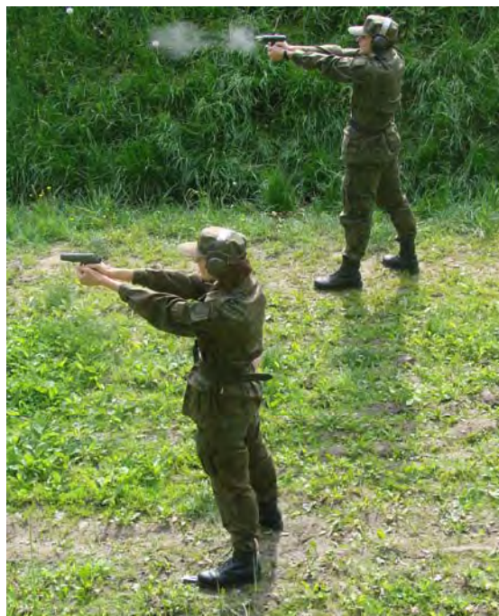
Zajęcia na strzelnicy otwartej

Nowoczesna baza szkoleniowa, profesjonalizm kadry zespołu pozwala przygotować funkcjonariuszy do działania w warunkach zbliżonych do warunków jego pracy-służby.