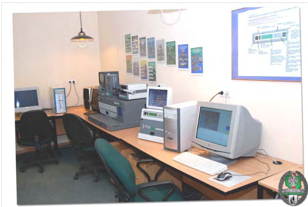
Pracownia badań dokumentów

Pośrednim, ale bardzo istotnym efektem projektu była modernizacja bazy dydaktycznej i sprzętowej Centrum. Ze środków finansowych przekazanych na jego realizację zostały zmodernizowane sale wykładowe – utworzono nowoczesne pracownie: badań dokumentów, fotografii oraz kontroli ruchu granicznego.