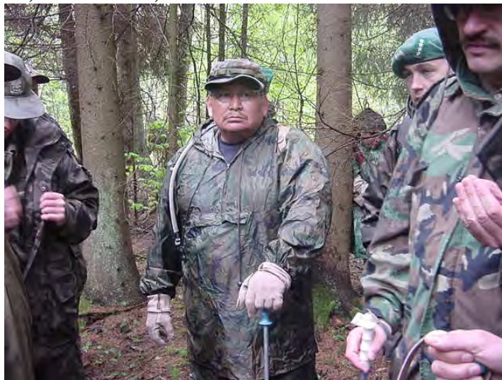
Zajęcia z tropicielami śladów

W naszej szkole często gościmy przedstawicieli służb ochrony granic innych państw, nie tylko europejskich, np. szkolenie organizowane przez amerykańskich tropicieli śladów, czy też wizyta przedstawicieli służb gruzińskich, azerskich, bałkańskich.