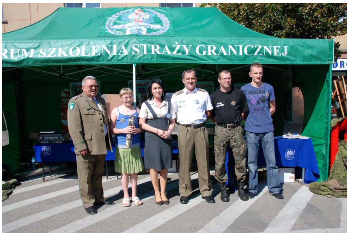
Mława – 70 rocznica wybuchu II wojny światowej

Zarówno w roku ubiegłym, jak i w bieżącym włączyliśmy się w obchody rocznicy (69 i 70) wybuchu II wojny światowej organizowane przez władze Mławy, wspierając sztab pasjonatów chcących przywrócić pamięć bohaterów września 1939 roku.