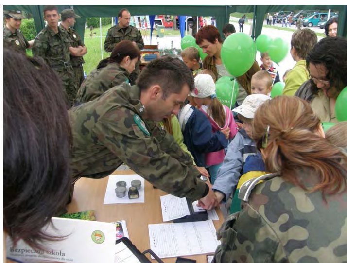
„Dzień Dziecka 2009 – Bezpieczne wakacje” Kętrzyn 2009

Niemala część aktywności Wydziału poświęcona jest upamiętnianiu tradycji polskich formacji granicznych. Organizowane od kilku lat konferencje zakończyły się wydaniem szeregu publikacji wysoko ocenionych w gronie osób zawodowo zajmujących się zagadnieniem.