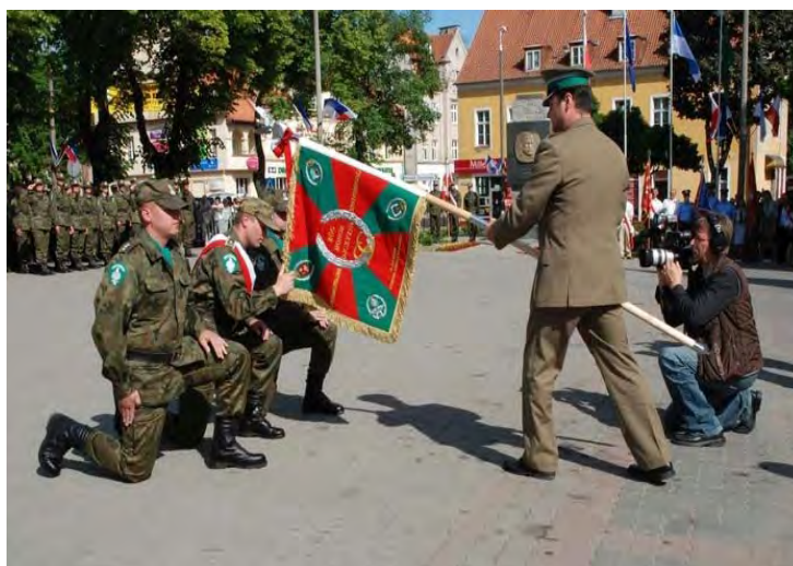
Nadanie sztandaru szkole

Wcześniej zrealizowane projekty, jak choćby organizowane konferencje i uroczystości (w tym te najważniejsze, związane z nadaniem szkole sztandaru i imienia) stały się przyczynkiem do tego, aby zbliżającą się rocznicę potraktować i przygotować na nieodbiegającym od już wypracowanych standardów poziomie.