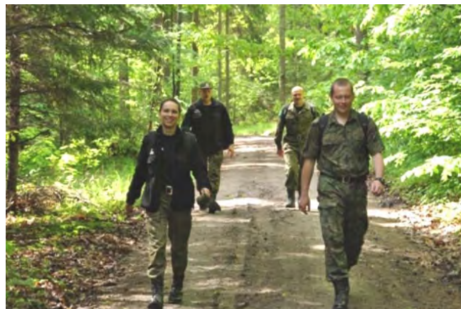
Zajęcia w terenie