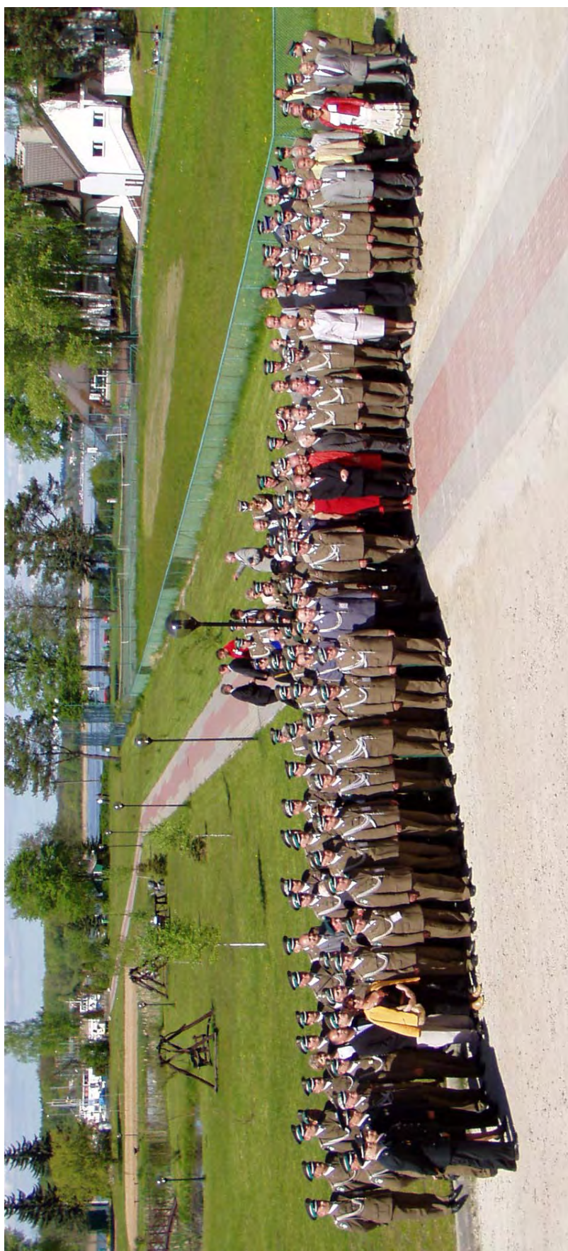
Gizycko 16.05. 2005 – XIV Rocznicą Powstania Straży Granicznej