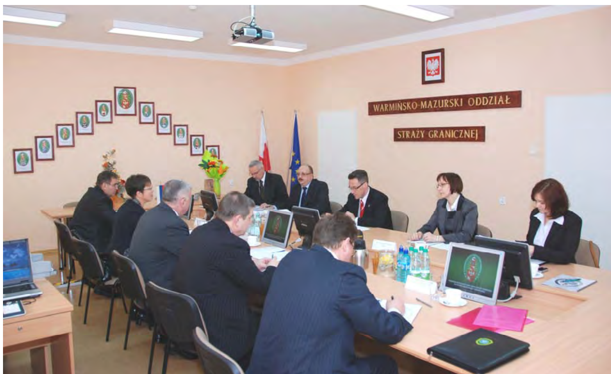
Polsko-Rosyjska Grupa Robocza ds. Współpracy Granicznej (2009 r.)

Pracownicy Zespołu Języków Obcych ściśle współpracują z krajowymi ośrodkami propagującymi nauczanie języków obcych i uczestniczą w różnych formach doskonalenia zawodowego organizowanych m.in. przez Warmińsko-Mazurski ODN oraz Centralny Ośrodek Doskonalenia Nauczycieli. Cenne są również spotkania z przedstawicielami innych szkół służb granicznych, podczas których nauczyciele wymieniają się doświadczeniami, materiałami dydaktycznymi oraz prowadzą pokazowe lekcje.