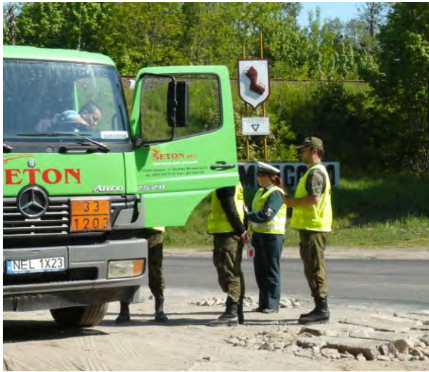
Funkcjonariusze podczas działań