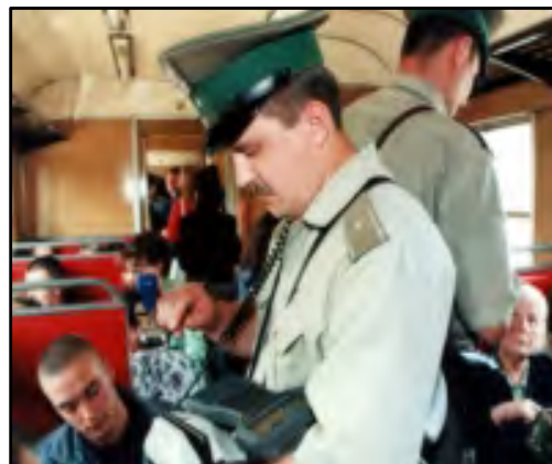
Funkcjonariusze w czasie wykonywania obowiązków służbowych

Zespół odgrywa istotną rolę w systemie kształcenia funkcjonariuszy Straży Granicznej na miarę współczesnych czasów. Dysponuje bazą dydaktyczną umożliwiającą słuchaczom zdobywanie wiedzy i umiejętności niezbędnych w wykonywaniu obowiązków służbowych w miejscu swojej służby.