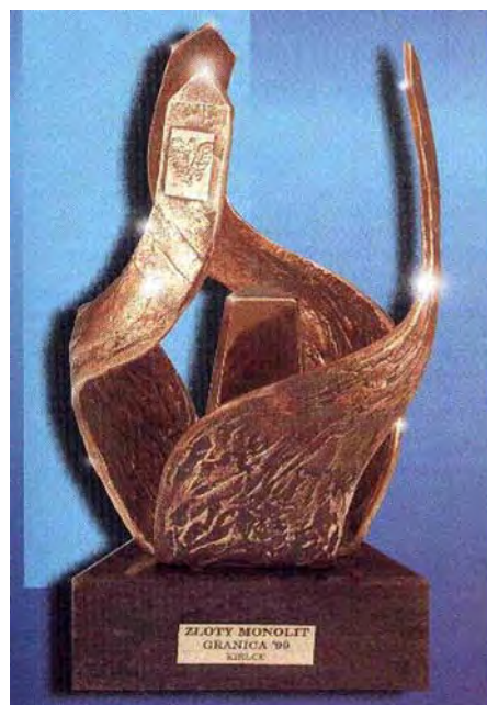
„Złoty Monoli” statuetka Komendanta Głównego – targi Kielce