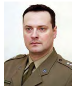
Komendant pplk SG Henryk Raczkowski

Centrum Szkolenia Straży Granicznej im. Żołnierzy Korpusu Ochrony Pogranicza w Kętrzynie