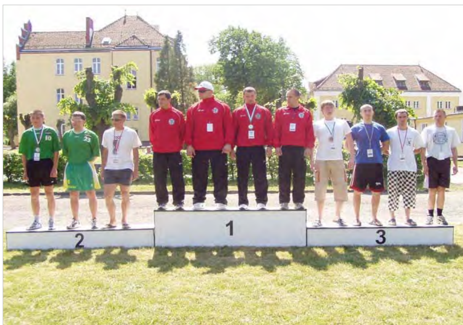
Międzynarodowe Zawody Szkół Służb Granicznych Krajów Nadbałtyckich, Kętrzyn 2007 – I miejsce ekipa CS SG