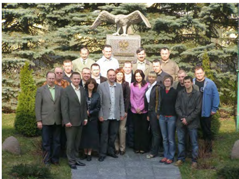
Warsztaty metodyczne z zakresu kształcenia zawodowego dorosłych (Kętrzyn 2009)

Zadania związane z doskonaleniem bazy dydaktycznej realizowane są poprzez racjonalne wykorzystanie posiadanych środków, wynikające z wnikliwej analizy priorytetów szkoleniowych.