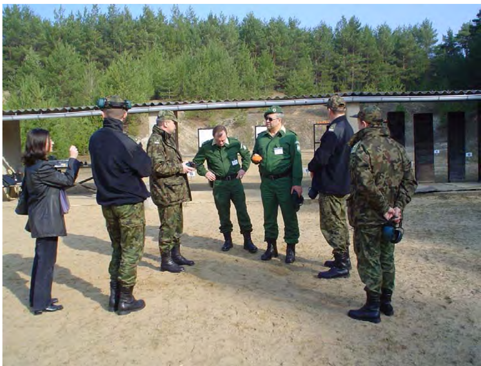
Wizyta wykładowców Zespołu Szkolenia Strzeleckiego w szkole Niemieckiej Straży Granicznej

Obok działalności stricte dydaktycznej, kadra zespołu organizuje zawody strzeleckie dla funkcjonariuszy Straży Granicznej, organizacji samorządowych i pozarządowych miasta Kętrzyna oraz powiatu kętrzyńskiego. Udział w powyższych przedsięwzięciach w bardzo dużym stopniu podwyższa umiejętności strzeleckie biorących udział w rywalizacji sportowej zawodników, a także konsoliduje zarówno środowisko obecnych i byłych funkcjonariuszy, jak również społeczeństwo lokalne z formacją mundurową.