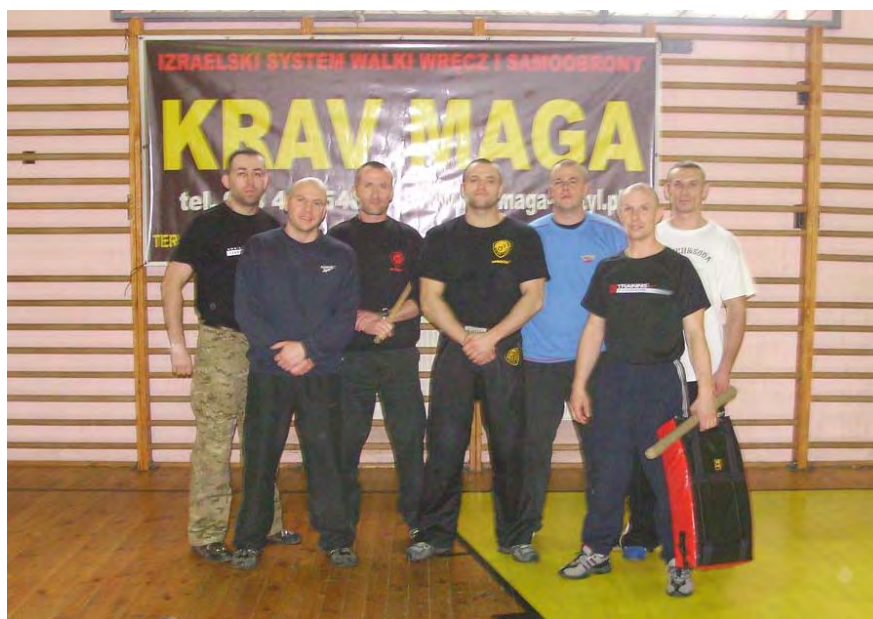
Warsztaty Krav Magi w Giżycku

W Zakładzie Działań Interwencyjnych obecnie pracuje 17 funkcjonariuszy i 3 pracowników cywilnych. Każdy z wykładowców i instruktorów posiada wysokie kwalifikacje predysponujące do prowadzenia zajęć w swoim zakresie. Stanowiąc jedno z ogniw systemu kształcenia w Centrum Szkolenia Straży Granicznej, przez swoją działalność dydaktyczną Zakład wnosi istotny wkład w kształtowanie postaw i przygotowanie funkcjonariuszy do wykonywania zadań służbowych, jakie stoją przed Strażą Graniczną.