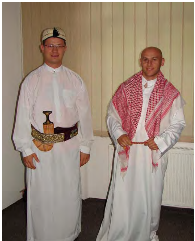
Kurs „Zarządzanie środowiskiem międzykulturowym dla funkcjonariuszy SG” (2008 r.)

W ramach współpracy międzynarodowej i wymiany doświadczeń z dziedziny kulturoznawstwa i edukacji międzykulturowej w maju 2009 roku w Centrum Szkolenia SG gościł przedstawiciel Straży Granicznej Akademii Bezpieczeństwa Wewnętrznego Republiki Estonii.