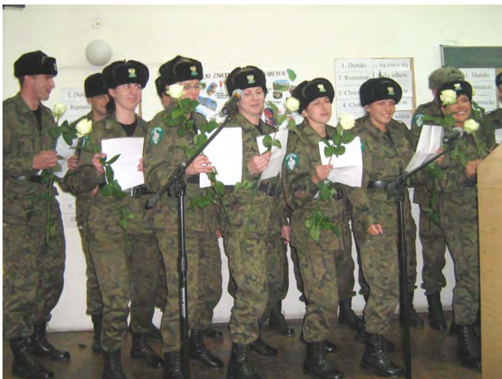
Słuchacze grupy 6 Szkolenia Podstawowego podczas konkursu (2007 r.)

Zespół Języków Obcych jest także odpowiedzialny za organizację i przeprowadzanie Europejskiego Dnia Języków. Impreza ta odbywa się corocznie i ma na celu propagowanie uczenia się języków obcych. Lektorzy przygotowują dla słuchaczy wiele atrakcji i konkursów z nagrodami.