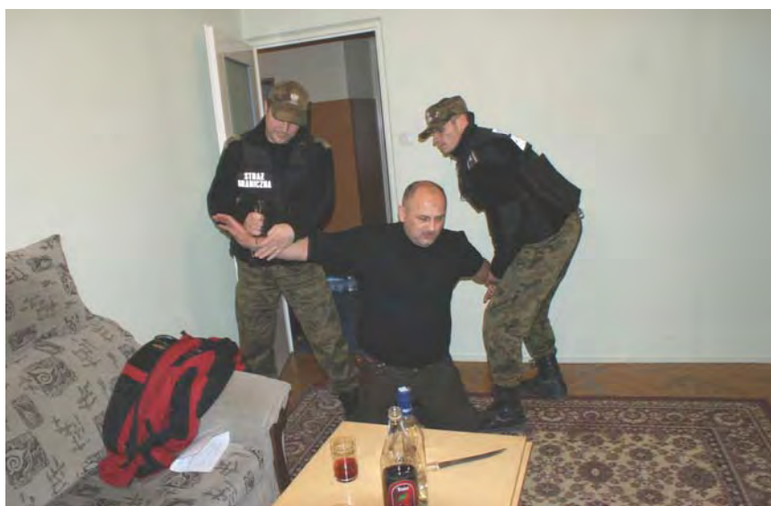
Współdziałanie funkcjonariuszy SG podczas interwencji w pomieszczeniu

Na poziomach wyższych tj. szkoleniu podoficerskim i szkoły chorążych realizowane są zagadnienia z zakresu współdziałania z partnerem w trakcie wykonywania zadań służbowych. Do realizacji powyższych celów służy nowoczesna baza dydaktyczna i szeroki wachlarz środków dydaktycznych. Zespół Interwencji Specjalnych ze względu na charakter działalności prowadzi również szkolenia specjalistyczne m.in. z zakresu doprowadzania osób zatrzymanych i stosowania wielofunkcyjnej pałki służbowej typu „TONFA”.