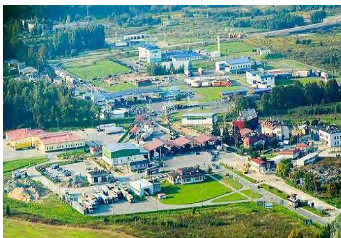
Drogowe przejście graniczne w Bezledach na granicy z Obwodem Kaliningradzkim –miejsce naszych zajęć praktycznych

Oprócz realizacji podstawowego procesu dydaktycznego organizujemy konsultacje, realizujemy szkolenia specjalistyczne i kursy doskonalące dla funkcjonariuszy SG. Prowadzimy działalność wydawniczą, opracowujemy programy szkolenia. Współpracujemy z Ośrodkami Szkolenia Straży Granicznej, szkołami Policji w Szczytnie i Legionowie oraz szkołami państw UE oraz instytucjami i szkołami cywilnymi.