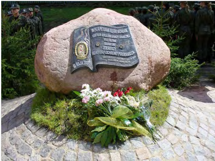
Obelisk „IN PERPETUAM REI MEMORIAM” odslonięty w związku z nadaniem Centrum imienia „Żołnierzy Korpusu Ochrony Pogranicza”

08.09.2009 – odslonięcie tablicy pamiątkowej „60-lecie szkolenia formacji granicznych w Kętrzynie”