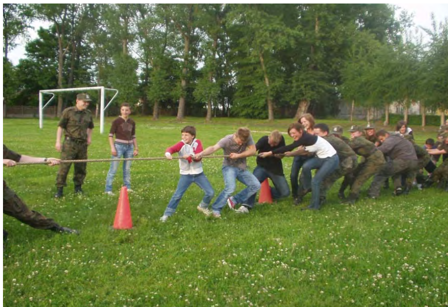
Festyn sportowy dla dzieci z Domu Dziecka w Bartoszczach (Kętrzyn 2009)

Przedsięwzięcia te kierowane są głównie do funkcjonariuszy SG, ale także do instytucji współpracujących z CS SG np. Dom Dziecka w Bartoszczach.