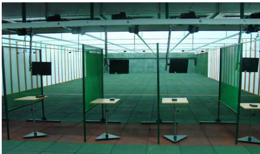
Nowoczesna strzelnica mieści osiem stanowisk

W czasie zajęć dydaktycznych często wykorzystywana jest strzelnica odkryta, mieszcząca się na terenie kompleksu koszarowego szkoły, co pozwala na doskonalenie umiejętności strzeleckich w różnych warunkach atmosferycznych.