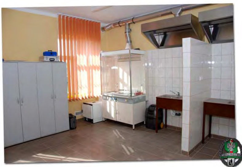
Pracownia daktyloskopii i chemii kryminalistycznej