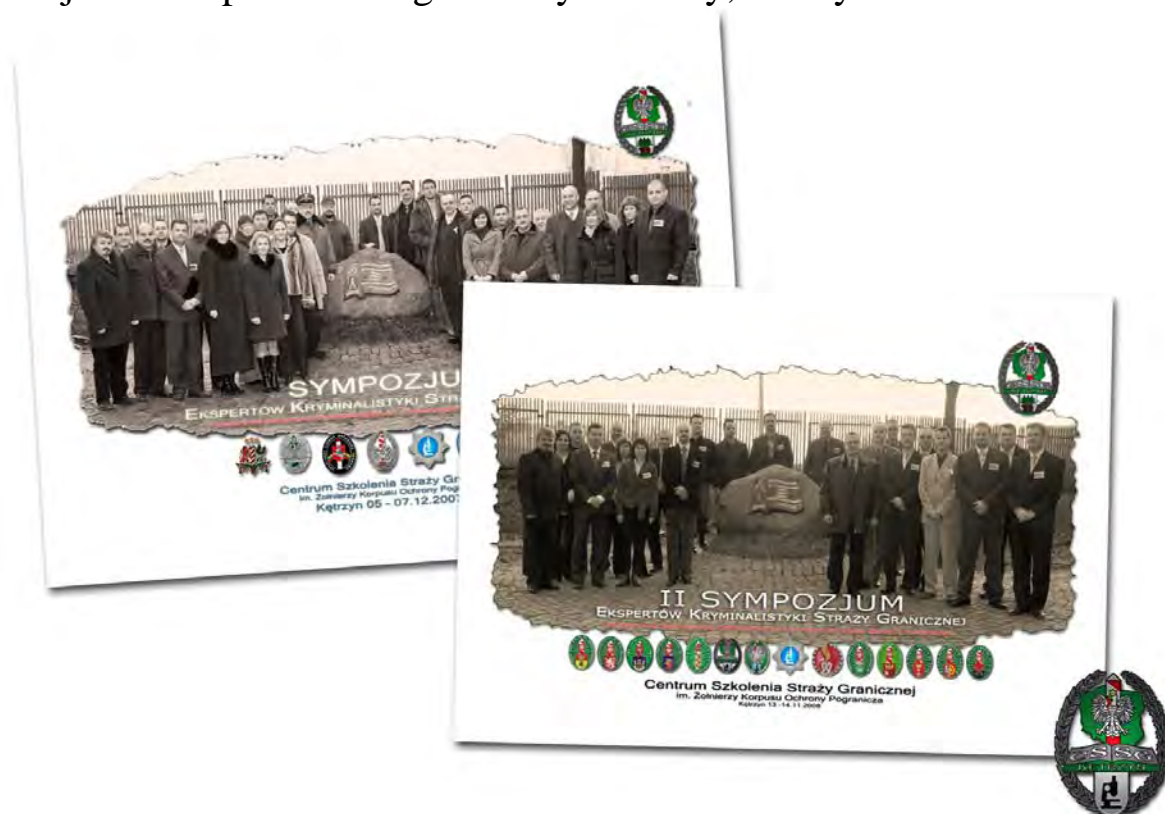
Uczestnicy Sympozjum Ekspertów Kryminalistyki SG

W ramy doskonalenia zawodowego wpisują się również sympozja, seminaria i warsztaty poświęcone tematyce kryminalistycznej. Przedstawiciele zakładu aktywnie w nich uczestniczą, a także są ich inicjatorami. Wśród najważniejszych należy wymienić „Techniczno-kryminalistyczne badania autentyczności dokumentów”, seminaria ekspertów organizowane przez PWPW S.A. oraz sympozja ekspertów kryminalistyki SG. Te ostatnie, zainicjowane w 2007 roku mają formę cyklicznych spotkań, a do udziału w nich zaprasza się ekspertów kryminalistyki SG wykonujących badania zakwestionowanych dokumentów. Sympozja odbywają się pod patronatem Laboratorium Kryminalistycznego SG. Ponadto uczestnikami są przedstawiciele Instytutu Ekspertyz Sądowych im. Jana Sehn'a w Krakowie, Uniwersytetu Warmińsko-Mazurskiego w Olsztynie, Centralnego Laboratorium Kryminalistycznego KGPol, Żandarmerii Wojskowej oraz eksperci służb granicznych Litwy, Łotwy i Estonii.