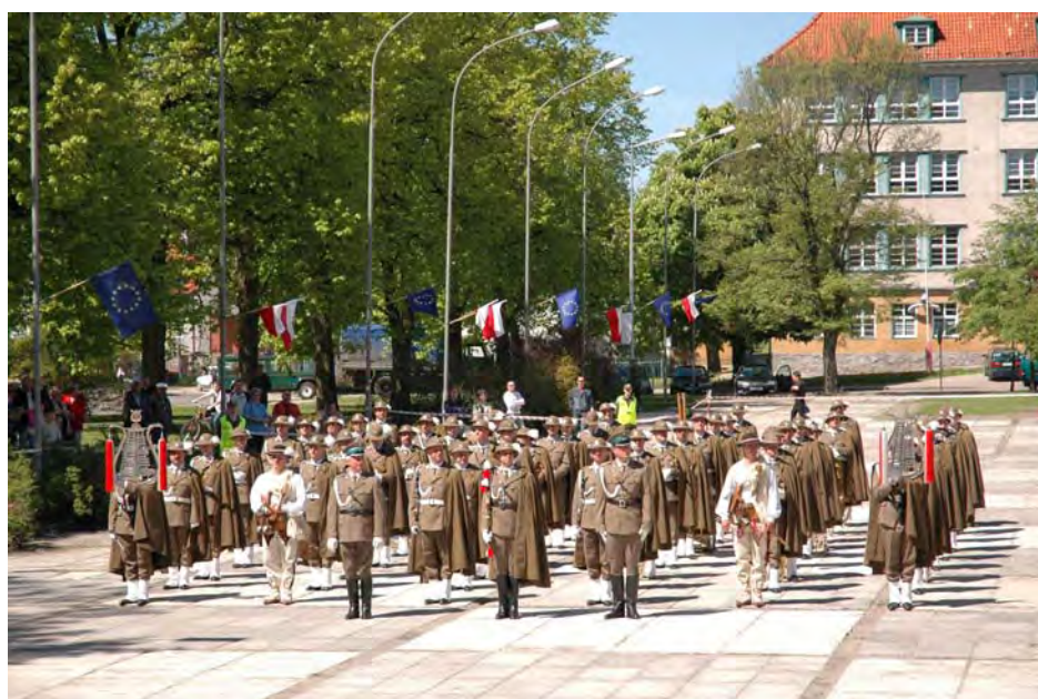
Giżycko – Plac Marszałka J. Piłsudskiego 16.05.2005 – Centralne Obchody XIV Rocznicy Powstania Straży Granicznej