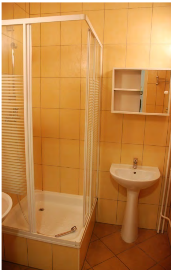
Wyremontowane pomieszczenia sanitarne w internacie w bloku nr 4

Poddasze bloku nr 4 wykorzystane zostało na sale wykładowe oraz pomieszczenia do rekreacji i wypoczynku słuchaczy.