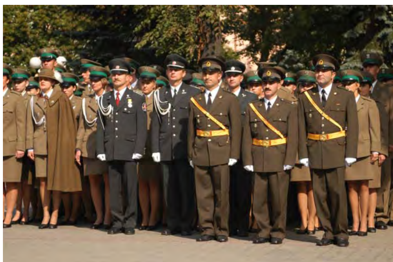
Międzynarodowa promocja Kursu Oficerskiego Kętrzyn 2004

Od kilku lat we współdziałaniu z Gabinetem Komendanta Głównego SG, Policją i Państwową Strażą Pożarną organizowane są przedsięwzięcia informacyjno-profilaktyczne: „Razem bezpieczniej”, „Bezpieczne miasto”, „Bądź bezpieczny w mieście ze Strażą Graniczną”, „Bezpieczne wakacje” (organizowane pod patronatem i z udziałem Szefa Biura Bezpieczeństwa Narodowego).