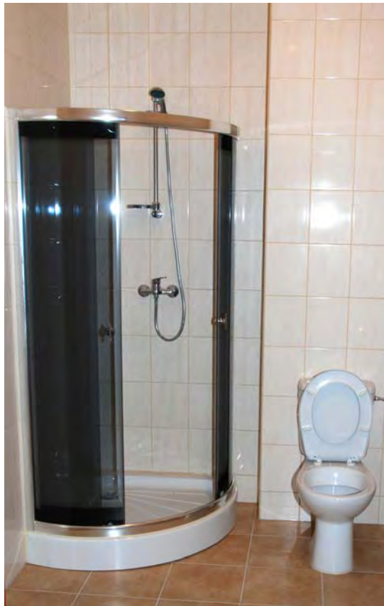
Wyremontowane pomieszczenia sanitarne w internacie w bloku nr 20