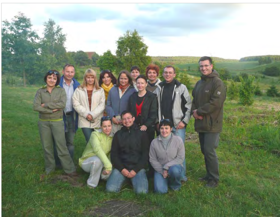
Uczestnicy szkolenia TRUS-S i TRUS-K z trenerami z Niemiec (2009 r.)

W obliczu dynamicznych zmian w strategii i sposobach ochrony granicy państwowej, dokonywania kontroli granicznej oraz zróżnicowanych grup cudzoziemców, z którymi funkcjonariusze mają kontakt służbowy występuje konieczność doskonalenia ich kwalifikacji w kierunku kształtowania kompetencji międzykulturowych. Stąd też w ostatnim czasie kładziony jest nacisk na systematyczne i wszechstronne doskonalenie zawodowe funkcjonariuszy w zakresie międzykulturowości, modelowanie postawy tolerancji i zrozumienia oraz umiejętności skutecznego komunikowania się z przedstawicielami innych kultur.