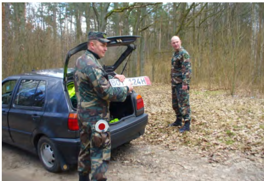
Warsztaty metodyczne nt. kontroli osób w pojazdach z instruktorami szkoły z Litwy

Na różnego rodzaju seminariach i warsztatach metodycznych wykładowcy i instruktorzy wymieniają się swoimi doświadczeniami wzbogacając tym samym swój zasób wiedzy teoretycznej i umiejętności praktycznych.