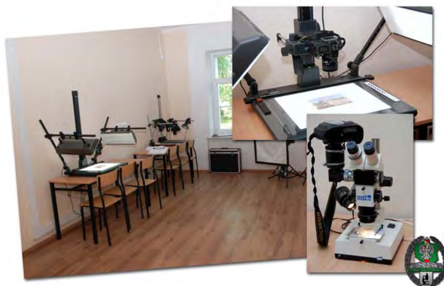
Pracownia fotografii kryminalistycznej

Pośrednim, ale bardzo istotnym efektem projektu była modernizacja bazy dydaktycznej i sprzętowej Centrum. Ze środków finansowych przekazanych na jego realizację zostały zmodernizowane sale wykładowe – utworzono nowoczesne pracownie: badań dokumentów, fotografii oraz kontroli ruchu granicznego.