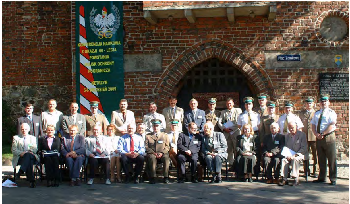
Kętrzyn 5-6.09.2005 konferencja naukowa z okazji 60-lecia powstania Wojsk Ochrony Pogranicza

W aktywność tę wpisały się również budowa i odsłonięcie obelisku „Na Straży Polskich Granic”, wykonanie i odsłonięcie tablic: „In Perpetuum Rei Memoriam” – w związku z nadaniem imienia Centrum oraz tablicy na bloku 27 poświęconej 60-leciu szkolenia formacji granicznych w Kętrzynie 1949-2009.