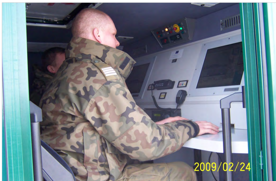
Szkolenie operatorów pojazdów obserwacyjnych

W ramach szkoleń specjalistycznych oraz kursów doskonalących funkcjonariusze Zespołu Technicznej Ochrony Granicy uczą przyszłych operatorów obsługi i wykorzystania pojazdów obserwacyjnych. Zarówno jeden jak i drugi z wymienionych sprzętów mogą być wykorzystywane w warunkach nocnych lub ograniczonej widoczności.