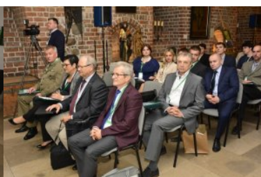
IX Międzynarodowe Sympozjum Ekspertów Kryminalistyki Służb Granicznych