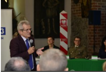
IX Międzynarodowe Sympozjum Ekspertów Kryminalistyki Służb Granicznych