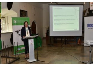
IX Międzynarodowe Sympozjum Ekspertów Kryminalistyki Służb Granicznych