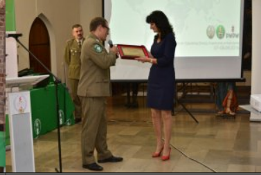
IX Międzynarodowe Sympozjum Ekspertów Kryminalistyki Służb Granicznych