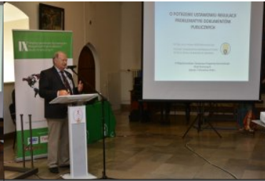
IX Międzynarodowe Sympozjum Ekspertów Kryminalistyki Służb Granicznych