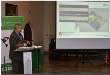
IX Międzynarodowe Sympozjum Ekspertów Kryminalistyki Służb Granicznych