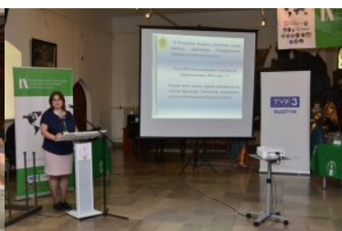
IX Międzynarodowe Sympozjum Ekspertów Kryminalistyki Służb Granicznych