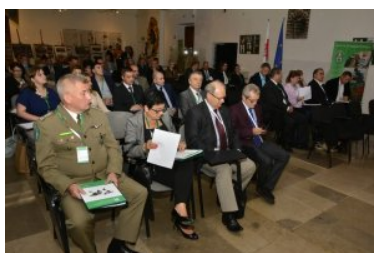
IX Międzynarodowe Sympozjum Ekspertów Kryminalistyki Służb Granicznych