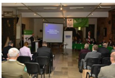
IX Międzynarodowe Sympozjum Ekspertów Kryminalistyki Służb Granicznych