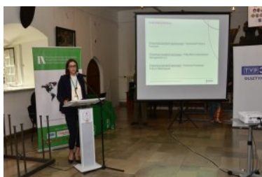
IX Międzynarodowe Sympozjum Ekspertów Kryminalistyki Służb Granicznych