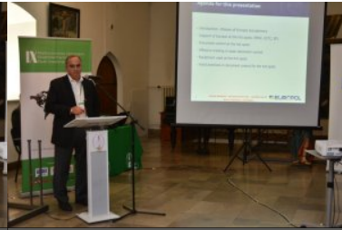
IX Międzynarodowe Sympozjum Ekspertów Kryminalistyki Służb Granicznych