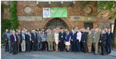
IX Międzynarodowe Sympozjum Ekspertów Kryminalistyki Służb Granicznych