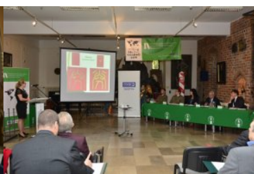
IX Międzynarodowe Sympozjum Ekspertów Kryminalistyki Służb Granicznych