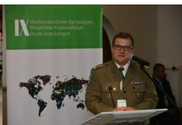
IX Międzynarodowe Sympozjum Ekspertów Kryminalistyki Służb Granicznych