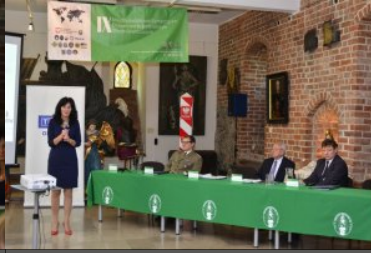
IX Międzynarodowe Sympozjum Ekspertów Kryminalistyki Służb Granicznych