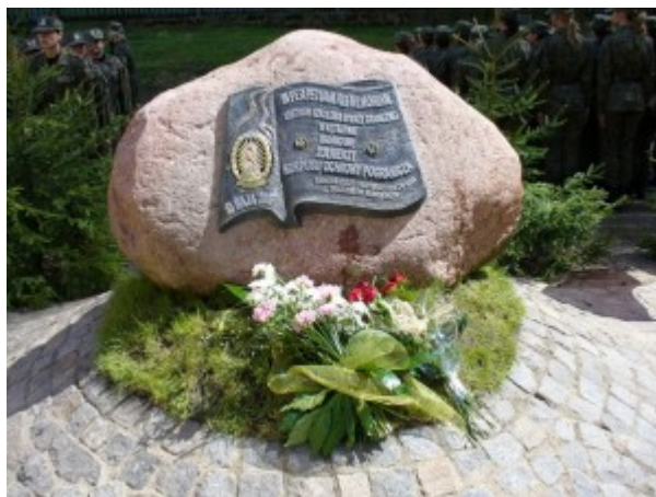
Fot. nr 10. Tablica pamiątkowa z okazji nadania imienia Żołnierzy Korpusu Ochrony Pogranicza Centrum Szkolenia Straży Granicznej

16 maja 2007 roku Minister Spraw Wewnętrznych i Administracji na wniosek Komendanta Centrum Szkolenia Straży Granicznej w Kętrzynie nadał Centrum Szkolenia Straży Granicznej w Kętrzynie imię „ Żołnierzy Korpusu Ochrony Pogranicza ”. Naturalną konsekwencją nadania imienia „ Żołnierzy Korpusu Ochrony Pogranicza ” było podjęcie starań, celem ufundowania kętrzyńskiej jednostce sztandaru.