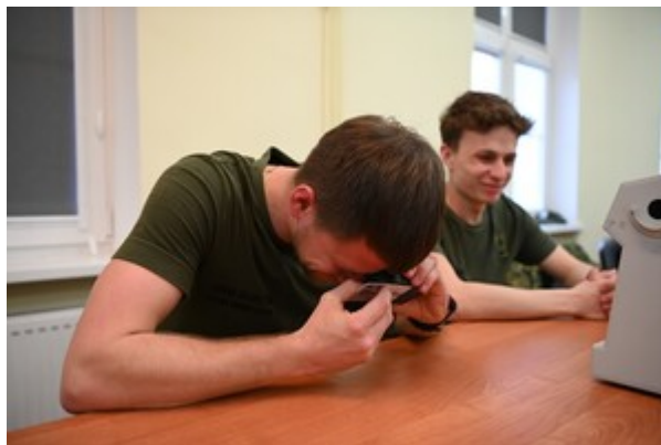
Weryfikacja dokumentów w praktyce