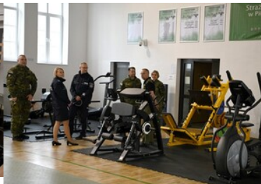
Prezentacja sali ćwiczeń