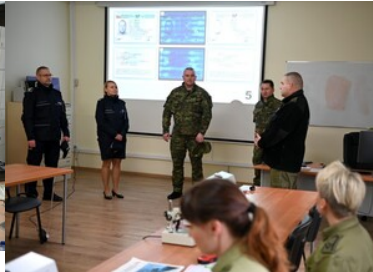
Prezentacja w trakcie zajęć