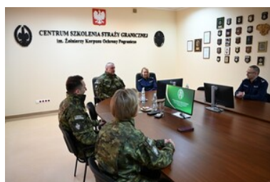
Wizyta w CSSG

Podpisanie porozumienia to ciąg dalszy doskonałej współpracy między mundurowymi instytucjami, która trwa już kilka lat. Przyczynia się do podnoszenia poziomu szkolenia i doskonalenia zawodowego oraz rozwijania merytorycznych kontaktów pomiędzy APwSz a CSSG.