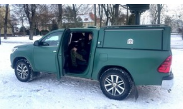
funkcjonariusz SG w pojeździe obserwacyjnym