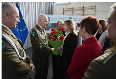
Życzenia od pracowników i funkcjonariuszy CSSG