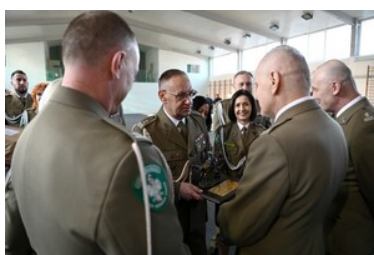
Życzenia od kadry CSSG