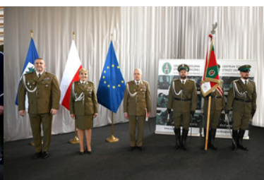
Zdjęcie przy sztandarze CSSG