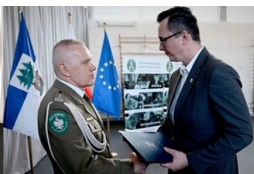
Życzenia od Burmistrza Kętrzyna