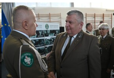
Życzenia od Nadleśniczego