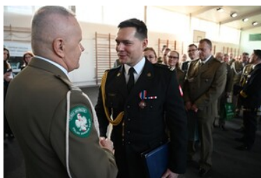
Życzenia od Komendanta Powiatowego PSP