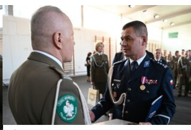
Życzenia od Komendanta Wojewódzkiego Policji