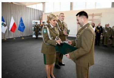
Gratulacje od gen. bryg. SG Wiolety Gorzkowskiej