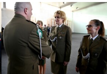
Wręczenie medalu 100-lecia KOP