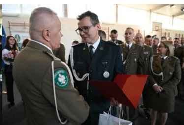
Życzenia od Naczelnika Warmińsko-Mazurskiego Urzędu Celno-Skarbowego w Olsztynie