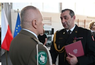
Życzenia od Zastępcy Komendanta Wojewódzkiego PSP