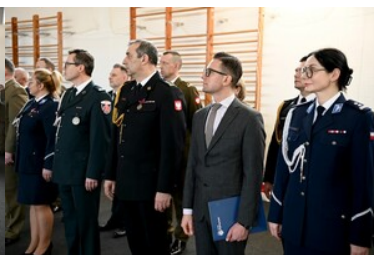
Zaproszeni goście podczas uroczystości