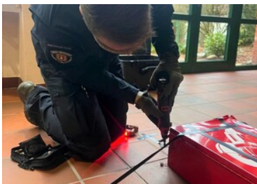
funkcjonariusz dokonuje neutralizacji

Dwa pierwsze dni szkolenia obejmowały zajęcia teoretyczne z podstaw elektroniki, komponentów służących do konstruowania improwizowanych urządzeń wybuchowych. Sprawdzano działanie sprzętu, m.in. urządzeń pomiarowych, czy obrazów rentgenowskich zagrożeń. Dwa ostatnie dni warsztatów poświęcone były nabyciu i doskonaleniu praktycznych umiejętności z zakresu manualnych technik neutralizacji. Przygotowane przez instruktorów scenariusze obejmowały sytuacje uwolnienia zakładników, neutralizacji improwizowanych urządzeń wybuchowych oraz urządzeń zawierających symulanty substancji chemicznych i biologicznych. Mundurowi mieli możliwość, w warunkach szkoleniowych, wykorzystać wiedzę z zajęć teoretycznych. Szkolenie zakończyło się w połowie grudnia br.