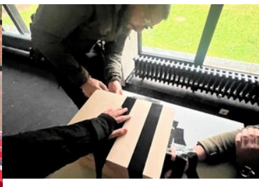
funkcjonariusz neutralizuje urządzenie