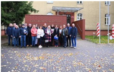
Warsztaty z fałszerstw dokumentów