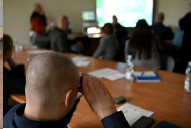
Warsztaty z fałszerstw dokumentów