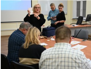
Warsztaty z fałszerstw dokumentów