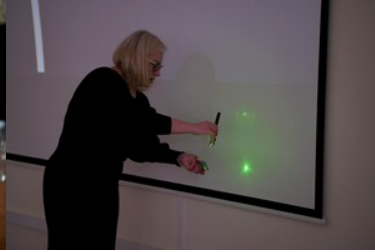
Warsztaty z fałszerstw dokumentów