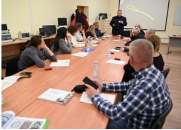
Warsztaty z fałszerstw dokumentów