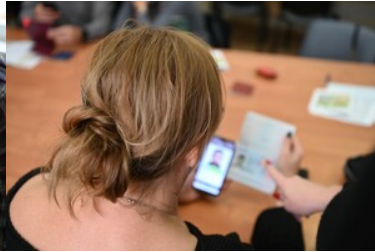
Warsztaty z fałszerstw dokumentów