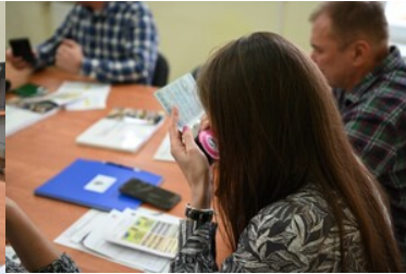
Warsztaty z fałszerstw dokumentów