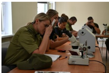
Dokumenty nie mają dla nas żadnych tajemnic

W kursie trwającym od 19-23 sierpnia br. wzięli udział funkcjonariusze z Nadodrzańskiego, Nadbużańskiego, Bieszczadzkiego oraz Warmińsko-Mazurskiego Oddziału Straży Granicznej.