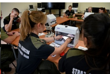
Dokumenty nie mają dla nas żadnych tajemnic