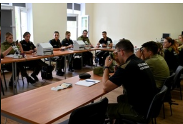
Dokumenty nie mają dla nas żadnych tajemnic