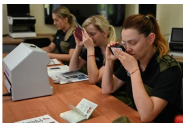
Dokumenty nie mają dla nas żadnych tajemnic