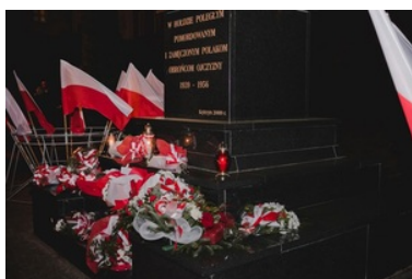
W hołdzie Żołnierzom Wyklętym