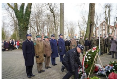
W hołdzie Żołnierzom Wyklętym