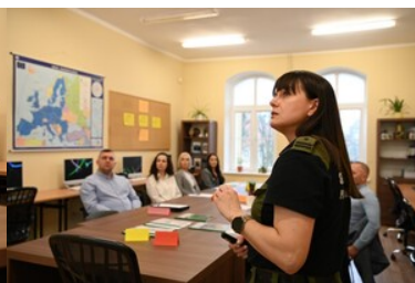
zajęcia z podstaw analizy ryzyka CIRAM