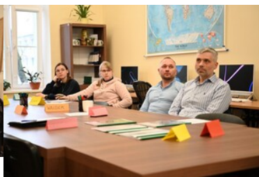
zajęcia z podstaw analizy ryzyka CIRAM