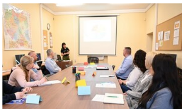
zajęcia z podstaw analizy ryzyka CIRAM

Uczestnikami szkolenia byli funkcjonariusze z Podlaskiego, Nadbużańskiego, Warmińsko-Mazurskiego Oddziału Straży Granicznej oraz Ośrodka Szkoleń Specjalistycznych SG w Lubaniu.