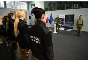
Szkolenie w zakresie szkoły chorążych rozpoczęte