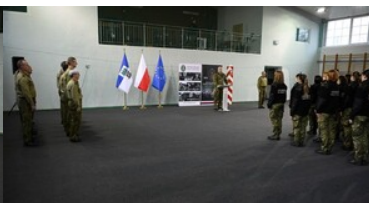
Szkolenie w zakresie szkoły chorążych rozpoczęte