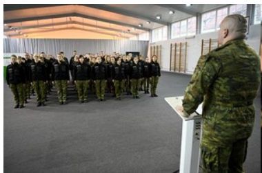
Szkolenie w zakresie szkoły chorążych rozpoczęte

Szkolenie w zakresie szkoły chorążych podzielone jest na dwie części tj. szkolenie zawodowe i szkolenie wspierające. Część pierwsza obejmuje tematy poświęcone zadaniom w ochronie granicy państwowej i kontroli ruchu granicznego, a także nielegalnej migracji. Tymczasem część wspierająca szkolenia uwzględnia strzelanie z broni palnej i techniki interwencji.