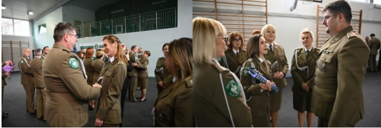
Pożegnanie z mundurem funkcjonariuszy CSSG