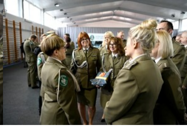
Pożegnanie z mundurem funkcjonariuszy CSSG