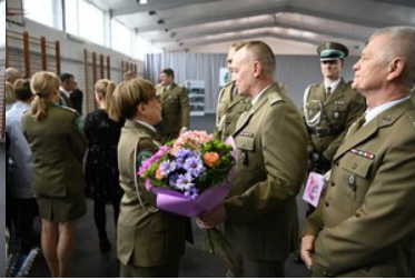
Pożegnanie z mundurem funkcjonariuszy CSSG