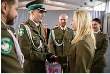
Pożegnanie z mundurem funkcjonariuszy CSSG