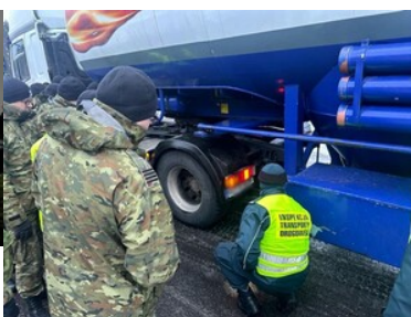
Stan techniczny pojazdów pod kontrolą