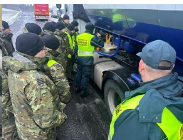
Stan techniczny pojazdów pod kontrolą