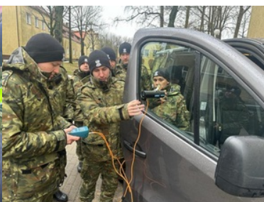
Stan techniczny pojazdów pod kontrolą