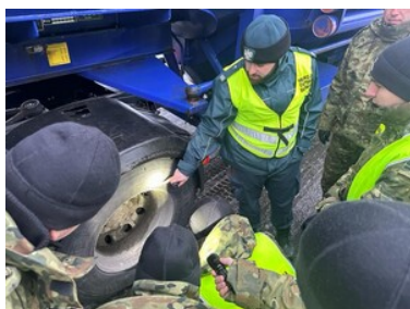
Stan techniczny pojazdów pod kontrolą