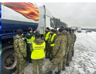
Stan techniczny pojazdów pod kontrolą