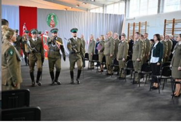
105 rocznica odzyskania przez Polskę niepodległości