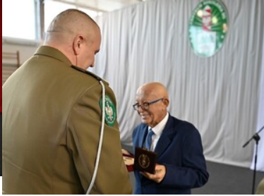
105 rocznica odzyskania przez Polskę niepodległości