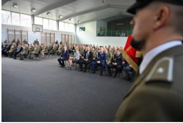
105 rocznica odzyskania przez Polskę niepodległości