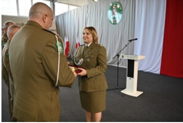
105 rocznica odzyskania przez Polskę niepodległości