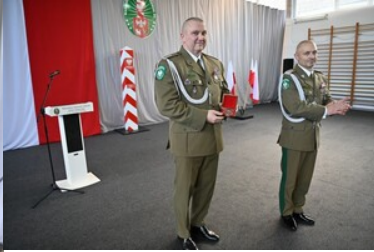
105 rocznica odzyskania przez Polskę niepodległości