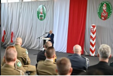
105 rocznica odzyskania przez Polskę niepodległości