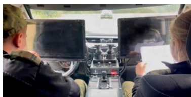
Granica polsko-białoruska pod stałą obserwacją