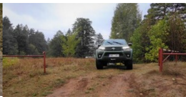
Granica polsko-białoruska pod stałą obserwacją