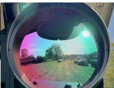
Granica polsko-białoruska pod stałą obserwacją