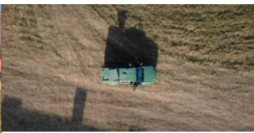
Granica polsko-białoruska pod stałą obserwacją