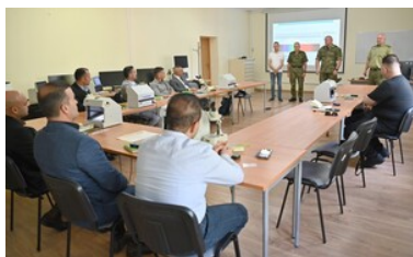
Szkoliliśmy rozpoznawania i wykrywania fałszerstw dokumentów

Szkolenie odbyło się w ramach projektu nr 2/9-2018/BK-FAMI "Wzmocnienie współpracy z państwami członkowskimi oraz państwami trzecimi w zakresie identyfikacji i powrotów- część II".