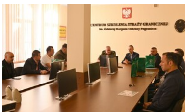
Szkoliliśmy rozpoznawania i wykrywania fałszerstw dokumentów