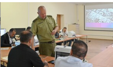
Szkoliliśmy rozpoznawania i wykrywania fałszerstw dokumentów