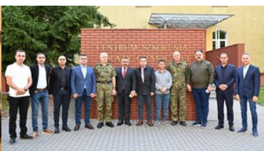
Szkoliliśmy rozpoznawania i wykrywania fałszerstw dokumentów