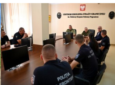
Doskonali umiejętności zapobiegania nielegalnego przekroczenia granicy