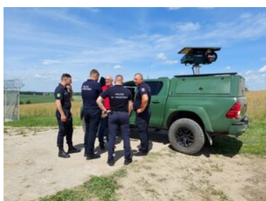
Doskonali umiejętności zapobiegania nielegalnego przekroczenia granicy