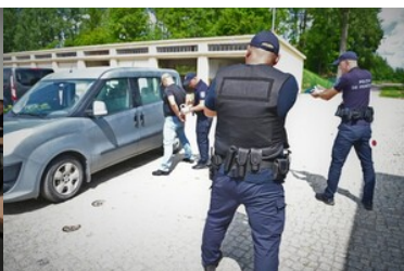
Doskonali umiejętności zapobiegania nielegalnego przekroczenia granicy