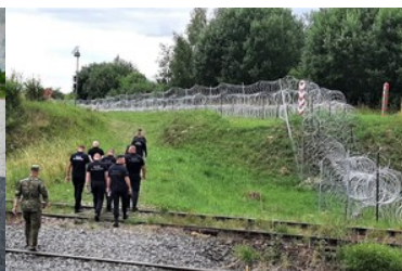
Doskonali umiejętności zapobiegania nielegalnego przekroczenia granicy