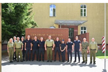
Doskonali umiejętności zapobiegania nielegalnego przekroczenia granicy