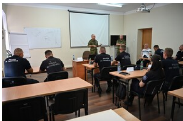
Doskonali umiejętności zapobiegania nielegalnego przekroczenia granicy