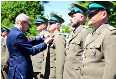
Święto Straży Granicznej