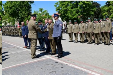
Święto Straży Granicznej