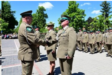
Święto Straży Granicznej