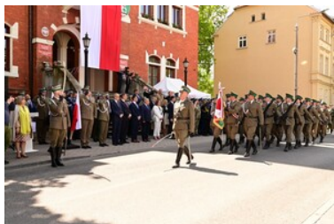
Święto Straży Granicznej