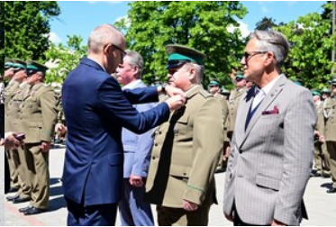
Święto Straży Granicznej