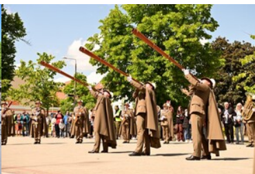
Święto Straży Granicznej