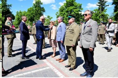
Święto Straży Granicznej