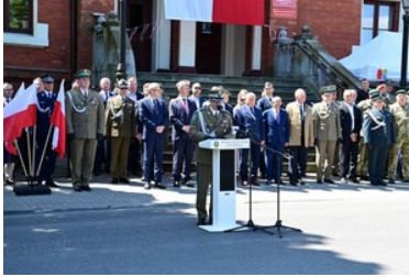
Święto Straży Granicznej