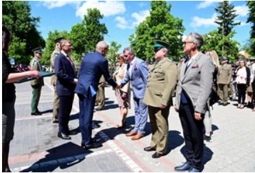
Święto Straży Granicznej