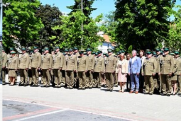
Święto Straży Granicznej