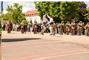
Święto Straży Granicznej