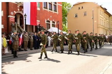
Święto Straży Granicznej