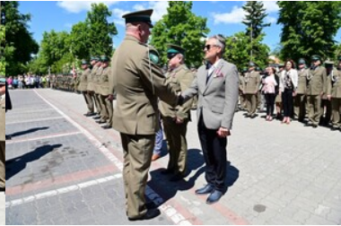
Święto Straży Granicznej