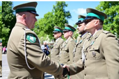
Święto Straży Granicznej