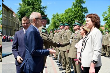
Święto Straży Granicznej