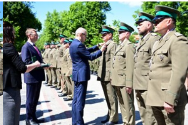
Święto Straży Granicznej