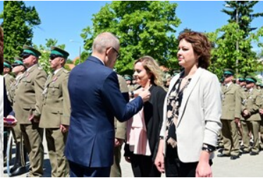
Święto Straży Granicznej