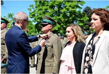
Święto Straży Granicznej