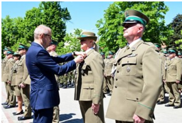
Święto Straży Granicznej