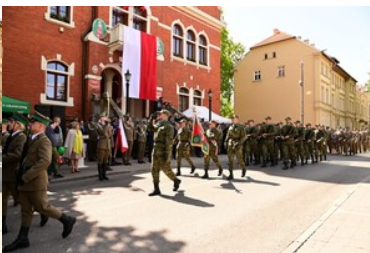
Święto Straży Granicznej