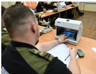
Dokumenty bez tajemnic

Ponadto w trakcie zajęć praktycznych z dokumentami kształtowano właściwe nawyki oraz wyrabiano umiejętności niezbędne w ocenie autentyczności dokumentów. W szkoleniu uczestniczyli funkcjonariusze z Podlaskiego, Bieszczadzkiego, Nadwiślańskiego, Śląskiego, Nadbużańskiego oraz Warmińsko-Mazurskiego Oddziału Straży Granicznej.