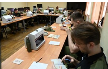
Dokumenty bez tajemnic