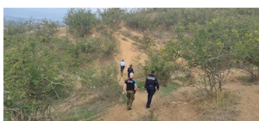
Udział funkcjonariusza CSSG w Operacji TERRA 2022