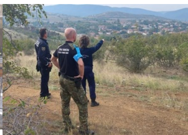
Udział funkcjonariusza CSSG w Operacji TERRA 2022