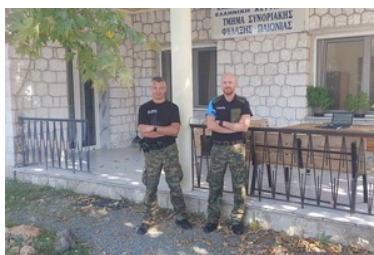
Udział funkcjonariusza CSSG w Operacji TERRA 2022

Powyższe oddelegowanie jest kolejnym przykładem, iż funkcjonariusze Centrum Szkolenia Straży Granicznej w Kętrzynie uczestniczą nie tylko we wsparciu wewnętrznych działań ale również realizują zobowiązania Straży Granicznej dotyczące międzynarodowych projektów. Rozwinięta i prowadzona na wielu płaszczyznach współpraca międzynarodowa jest jednym z podstawowych elementów decydujących o skuteczności działania służb granicznych.