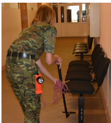
Druga edycja szkolenia specjalistycznego z zakresu rozpoznania minersko-pirotechnicznego

Absolwenci kursu zdobyte umiejętności będą wykorzystywać w codziennej służbie w swoich macierzystych jednostkach.