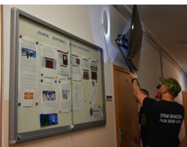
Druga edycja szkolenia specjalistycznego z zakresu rozpoznania minersko-pirotechnicznego