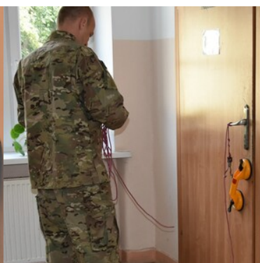
Druga edycja szkolenia specjalistycznego z zakresu rozpoznania minersko-pirotechnicznego