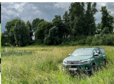
Operator - Kierowca Pojazdu Obserwacyjnego