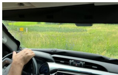
Operator - Kierowca Pojazdu Obserwacyjnego

UNIA EUROPEJSKA FUNDUSZ BEZPIECZEŃSTWA WEWNĘTRZNEGO