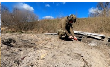
Szkolenie z zakresu działań minersko-pirotechnicznych