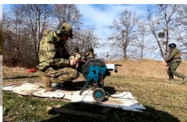
Szkolenie z zakresu działań minersko-pirotechnicznych