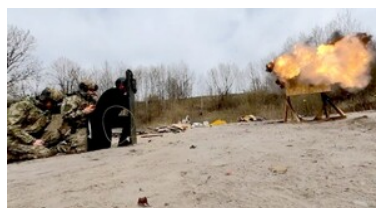
Szkolenie z zakresu działań minersko-pirotechnicznych

UNIA EUROPEJSKA FUNDUSZ BEZPIECZEŃSTWA WEWNĘTRZNEGO