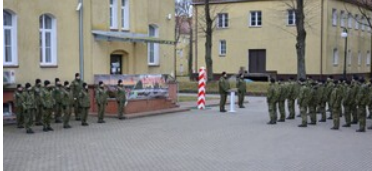
Podsumowanie pierwszej edycji szkoły chorążych