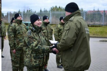
Podsumowanie pierwszej edycji szkoły chorążych