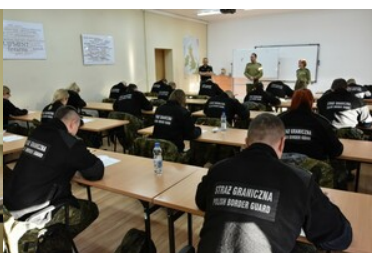
Podsumowanie pierwszej edycji szkoły chorążych