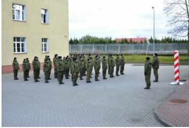
Podsumowanie pierwszej edycji szkoły chorążych