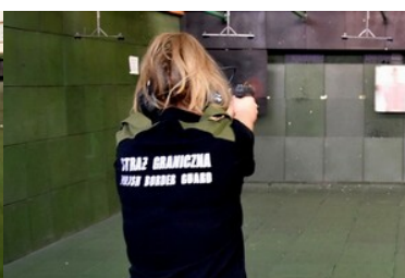
Podsumowanie pierwszej edycji szkoły chorążych