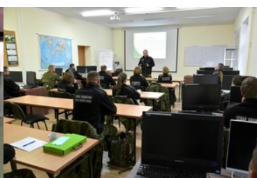
Podsumowanie pierwszej edycji szkoły chorążych