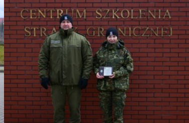
Podsumowanie pierwszej edycji szkoły chorążych