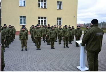
Podsumowanie pierwszej edycji szkoły chorążych