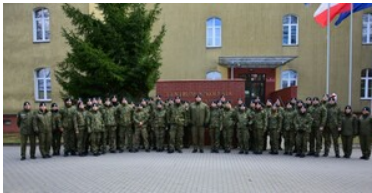
Podsumowanie pierwszej edycji szkoły chorążych