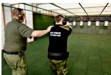
Podsumowanie pierwszej edycji szkoły chorążych

Szkolenie w zakresie szkoły chorążych podzielone jest na dwie części, pierwszą - szkolenie zawodowe obejmujące tematy poświęcone analizie i zadawaniu pytań, wybranym zagadnieniom prawa, a także warunkom efektywnej pracy zespołu. Część druga - szkolenie wspierające, poświęcone jest uzyskaniu umiejętności i wiedzy z zakresu wychowania fizycznego i relacje interpersonalne w służbie.