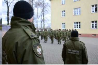
Podsumowanie pierwszej edycji szkoły chorążych