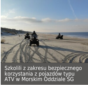
Szkolili z zakresu bezpiecznego korzystania z pojazdów typu ATV w Morskim Oddziale SG