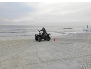
Szkolili z zakresu bezpiecznego korzystania z pojazdów typu ATV w Morskim Oddziale SG