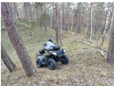
Szkolili z zakresu bezpiecznego korzystania z pojazdów typu ATV w Morskim Oddziale SG

Część praktyczną szkolenia obejmowało jazdę w różnych warunkach. W przypadku Krynicy Morskiej zwrócono szczególną uwagę ukształtowanie terenowe: piaszczystą plażę, pagórki wydmowe, dukty leśne i bezdroża oraz strome podjazdy i zjazdy, a przede wszystkim na zasady bezpiecznej i kulturalnej jazdy podczas mijania turystów poruszających się pieszo i rowerami. Największy nacisk nałożono na bezpieczeństwo i właściwą eksploatację pojazdów.