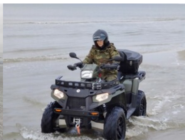
Szkolili z zakresu bezpiecznego korzystania z pojazdów typu ATV w Morskim Oddziale SG