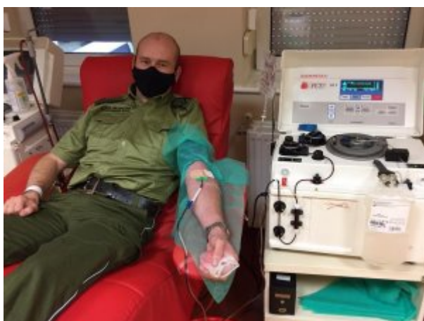
Dziękuję cię cennym darem z chorymi na covid-19