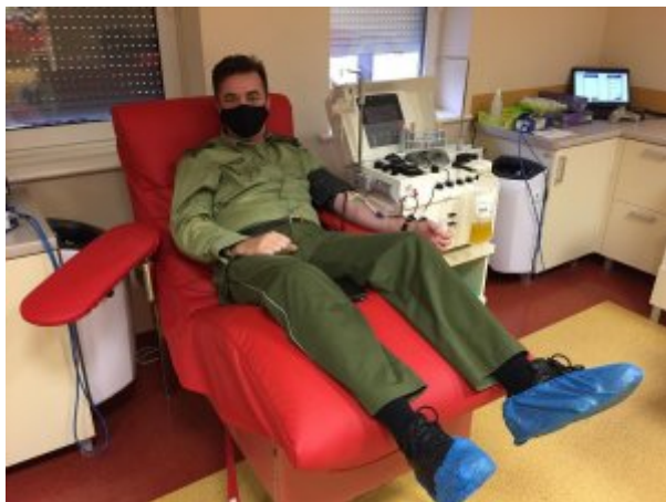
Dziękuję się cennym darem z chorymi na covid-19