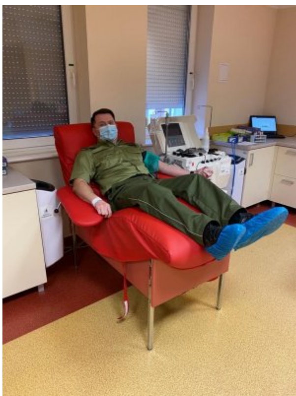
Dziela się cennym darem z chorymi na covid-19

Apelujemy do Wszystkich ozdrowieńców, to nie boli, a może uratować komuś życie!