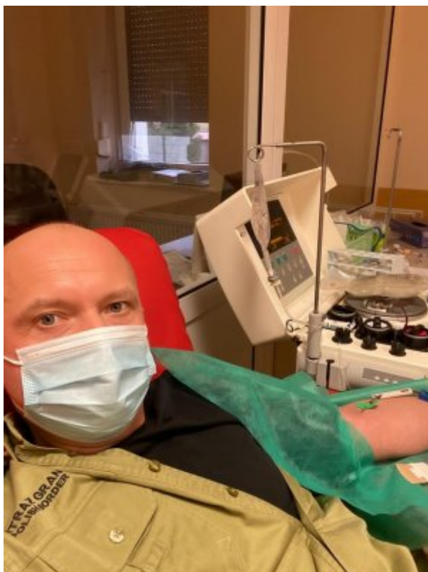
Dziękuję cię cennym darem z chorymi na covid-19