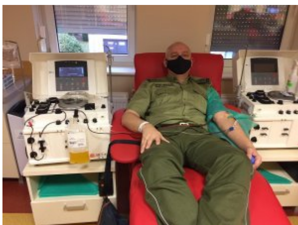
Dziękuję cię cennym darem z chorymi na covid-19