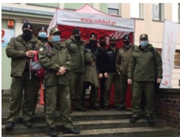
Dziękuję się cennym darem z chorymi na covid-19