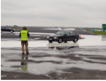
Współpraca między służbami w zakresie techniki jazdy