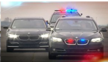
Współpraca między służbami w zakresie techniki jazdy