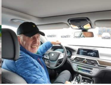
Współpraca między służbami w zakresie techniki jazdy