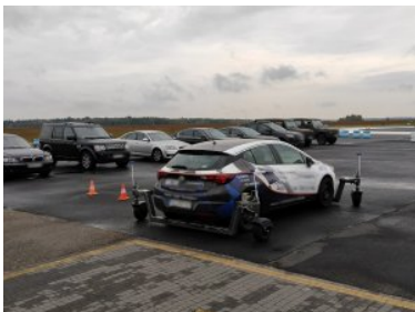
Współpraca między służbami w zakresie techniki jazdy

Spotkanie instruktorów techniki jazdy służb specjalnych i MSWiA było pierwszym spotkaniem mającym na celu pogłębianie współpracy w tym zakresie, określenia kierunków i wspólnych obszarów działania.