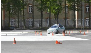
Funkcjonariusze Straży Granicznej za kierownicą pojazdów uprzywilejowanych