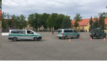
Funkcjonariusze Straży Granicznej za kierownicą pojazdów uprzywilejowanych