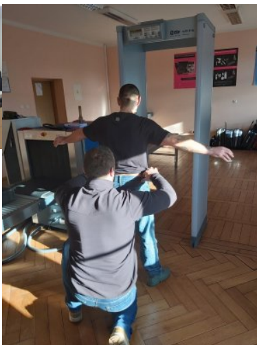
Szkolenie dla pracowników Ministerstwa Spraw Zagranicznych kierowanych do ochrony Polskich Placówek Dyplomatycznych