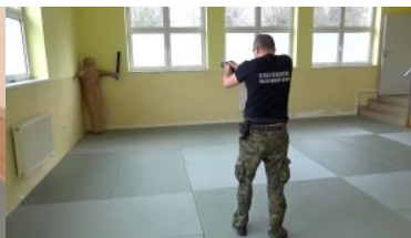
Posługiwanie się przedmiotami przeznaczonymi do obezwładniania osób za pomocą energii elektrycznej