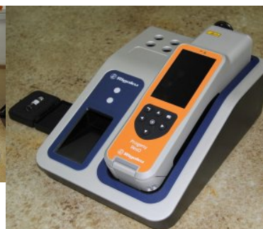
Nowy sprzęt w Centrum Szkolenia Straży Granicznej - podsumowanie 2019 r.