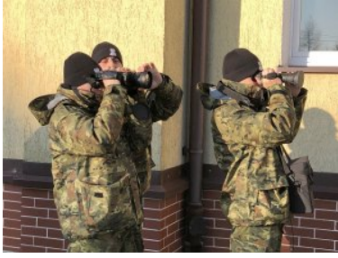
Nowy sprzęt w Centrum Szkolenia Straży Granicznej - podsumowanie 2019 r.