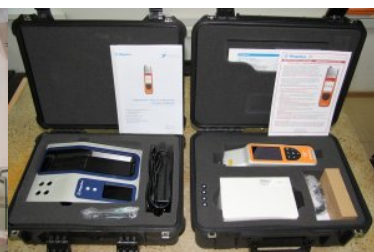
Nowy sprzęt w Centrum Szkolenia Straży Granicznej - podsumowanie 2019 r.