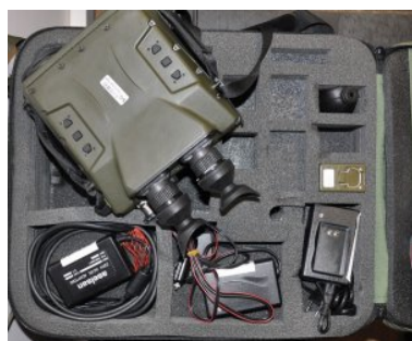
Nowy sprzęt w Centrum Szkolenia Straży Granicznej - podsumowanie 2019 r.