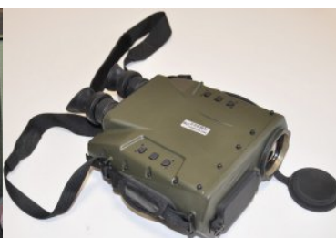
Nowy sprzęt w Centrum Szkolenia Straży Granicznej - podsumowanie 2019 r.