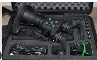
Nowy sprzęt w Centrum Szkolenia Straży Granicznej - podsumowanie 2019 r.