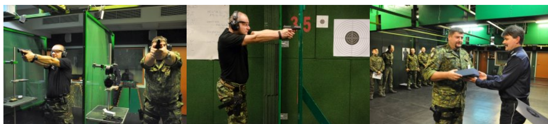
II miejsce reprezentacji Centrum Szkolenia SG w IX Otwartych Międzynarodowych