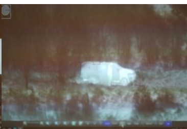
Kurs Operator - Kierowca Pojazdu Obserwacyjnego