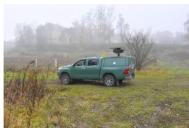
Kurs Operator - Kierowca Pojazdu Obserwacyjnego

Kursy obejmują zagadnienia związane z obsługą optoelektronicznego systemu obserwacyjnego, przeszkoleniem w zakresie poprawnej obsługi technicznej pojazdu oraz jazdą treningową w trudnym terenie. Zajęcia realizowane są metodą wykładów, pokazów i ćwiczeń praktycznych z wykorzystaniem symulatora-trenażera w sali wykładowej oraz pojazdu obserwacyjnego w terenie. Uczestnikami edycji byli funkcjonariusze Warmińsko-Mazurskiego, Podlaskiego, Nadbużańskiego oraz Bieszczadzkiego Oddziału Straży Granicznej. Kursy prowadzone były przez doświadczonych wykładowców Zakładu Granicznego Centrum Szkolenia SG.