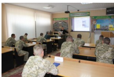
Szkolenie funkcjonariuszy Państwowej Służby Granicznej Ukrainy

Szkolenie zrealizowane zostało w ramach Projektu nr 234/2019/ADM2019 „Wzmacnianie Państwowej Służby Granicznej Ukrainy w zakresie zwalczania przestępczości transgranicznej”, opracowanego w kontekście programu Polska pomoc, będącym jednym z wielu elementów obszaru polityki zagranicznej Ministerstwa Spraw Zagranicznych Rzeczypospolitej Polski.