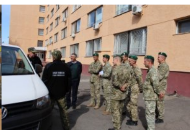
Szkolenie funkcjonariuszy Państwowej Służby Granicznej Ukrainy