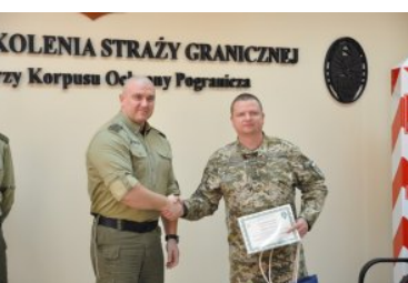
Szkolenie specjalistyczne dla funkcjonariuszy Państwowej Służby Granicznej Ukrainy