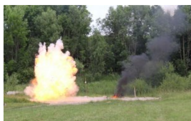
Szkolenie specjalistyczne dla funkcjonariuszy Państwowej Służby Granicznej Ukrainy