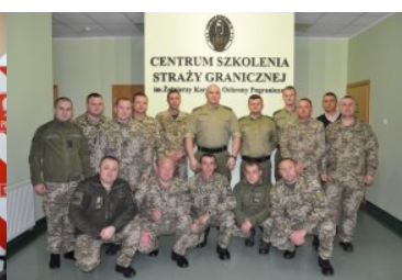
Szkolenie specjalistyczne dla funkcjonariuszy Państwowej Służby Granicznej Ukrainy