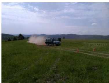
hamowanie z wykorzystaniem ABS

Równoległe realizowany był kurs doskonalący „Trening jazdy pojazdami terenowymi”. Funkcjonariusze w części praktycznej kursu, mogli ocenić swoje umiejętności i możliwości terenowe pojazdów. Ćwiczenia prowadzone były w trudnym, bieszczadzkiem terenie, gdzie ćwiczone były podjazdy, zjazdy, jazda w trawersie, a także brodenie i jazda w koleinach. Umiejętne dobieranie prędkości i właściwe stosowanie przełożeń skrzyni redukcyjnej, czyli wszystko to z czym na co dzień spotyka się kierowca, a co ma duże znaczenie w eksploatacji pojazdów służbowych. Ćwiczone również obsługę wyciągarki i sprzętu offroadowego będącego na wyposażeniu pojazdu.