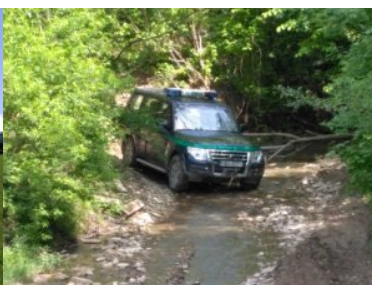
przejazd ciekami wodnymi