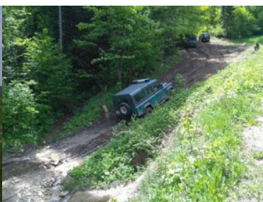
jazda w grząskim terenie