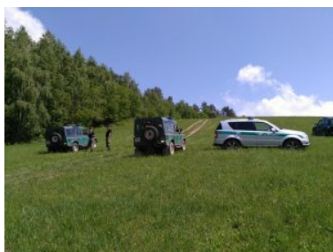
podjazdy i zjazdy z wykorzystaniem reduktora