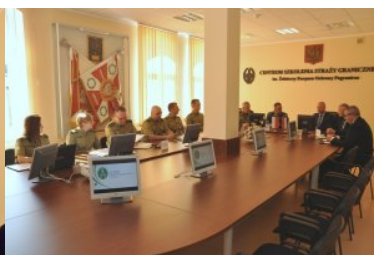
Wizyta przedstawicieli Holenderskiej Żandarmerii Królewskiej