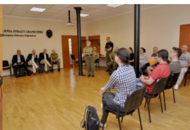
Wizyta przedstawicieli Holenderskiej Żandarmerii Królewskiej