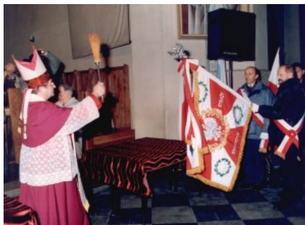
Fot. nr 6. Poświęcenie sztandaru Centrum Szkolenia Straży Granicznej przez Biskupa

Po roku od utworzenia Centrum, Komendant Główny Straży Granicznej ppłk dypl. Krzysztof Janczak decyzją z dnia 6 lipca 1992 roku nadał Centrum Szkolenia SG Sztandar, którego uroczyste wręczenie nastąpiło w dniu 14 listopada 1992 roku. Aktu poświęcenia sztandaru dokonał ówczesny Biskup Polowy Wojska Polskiego gen. bryg. Sławoj Leszek GŁÓDŹ.