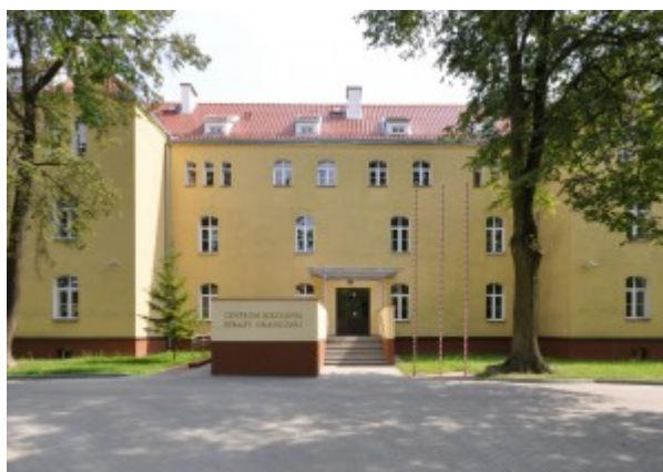
Fot. nr 14. Nowa siedziba Centrum Szkolenia Straży Granicznej im .Żołnierzy Korpusu Ochrony PograniczaDziś należy potwierdzić wymierne, dające się określić efekty wieloletniej działalności dydaktycznej kętrzyńskiej szkoły Straży Granicznej.

Zajęcia prowadzone są z maksymalnym wykorzystaniem doświadczeń zawodowych specjalistów z oddziałów Straży Granicznej w oparciu o nowe, aktywne metody nauczania. System pomiaru efektywności pracy uwidacznia wzrost poziomu umiejętności słuchaczy notowany w trakcie testów kompetencyjnych i egzaminów. Potwierdzają to również dobre i bardzo dobre wyniki w służbie osiągnęte przez absolwentów Centrum Szkolenia Straży Granicznej.