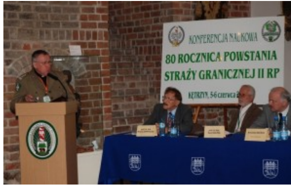
Fot. nr 9. Konferencja naukowa w 80. Rocznicę Powstania Straży Granicznej II RP

Kętrzyńska szkoła Straży Granicznej znana jest w cywilnych środowiskach akademickich z organizacji licznych sympozjów i konferencji naukowych, których efektem są liczne publikacje pokonferencyjne, artykuły i skrypty oraz filmowe i fotograficzne materiały dydaktyczne.