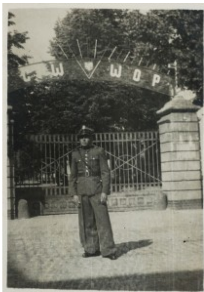
Fot. nr 1. Żołnierz przed bramą wejściową do Centrum Wyszkolenia WOP w Ostródzie.

Centrum Szkolenia Straży Granicznej w Kętrzynie jest jednym z trzech ośrodków w Straży Granicznej przygotowujących wysoko wykwalifikowane kadry do prestiżowej i odpowiedzialnej służby w ochronie granic Rzeczypospolitej Polskiej. Swoją działalność realizuje w oparciu o obiekty, w których szkolenie dla potrzeb formacji granicznych prowadzone jest od ponad sześćdziesięciu lat, kontynuując wieloletnie tradycje szkolnictwa zawodowego powstałych po II wojnie światowej Wojsk Ochrony Pogranicza.