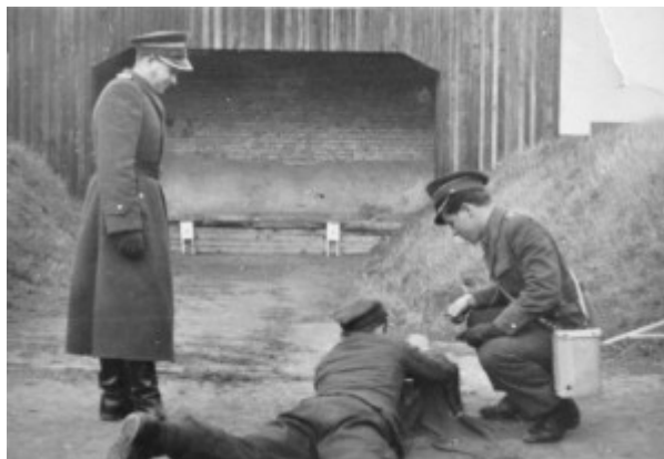
Fot. nr 2. Szkolenie strzeleckie w Oficerskiej Szkole WOP w Kętrzynie

W roku 1970 szkołę rozformowano, a w jej miejsce utworzono Ośrodek Szkolenia Wojsk Wewnętrznych, w ramach którego funkcjonowała Szkoła Chorążych i Szkoła Podoficerów Zawodowych WOP. Dwa lata później ośrodek zmienił nazwę na Ośrodek Szkolenia Wojsk Ochrony Pogranicza.