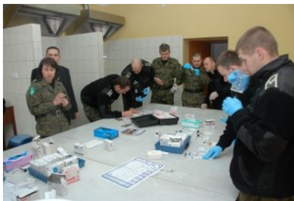
Fot. nr 8. Zajęcia w laboratorium kryminalistycznym Centrum Szkolenia Straży Granicznej

Szkolenia prowadzone są w salach wykładowych i specjalistycznych laboratoriach wyposażonych w najnowocześniejszy sprzęt techniczny. Słuchacze, poznają tajniki wykonywania zawodu i zastosowania sprzętu i urządzeń analogicznych do tego, który znajduje się na wyposażeniu jednostek organizacyjnych Straży Granicznej.