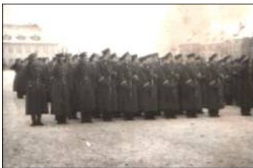
Fot. nr 3. Uroczysta zbiórka w Ośrodku Szkolenia WOP w Kętrzynie

Istotną datą w działalności kętrzyńskiej szkoły formacji granicznych jest dzień 1 kwietnia 1978 roku. W 1978 roku, w związku z utworzeniem w Ośrodku Szkolenia WOP filii wrocławskiej Wyższej Szkoły Oficerskiej Wojsk Zmechanizowanych im. Tadeusza Kościuszki, naukę w Kętrzynie rozpoczęli pierwsi podchorążowie.