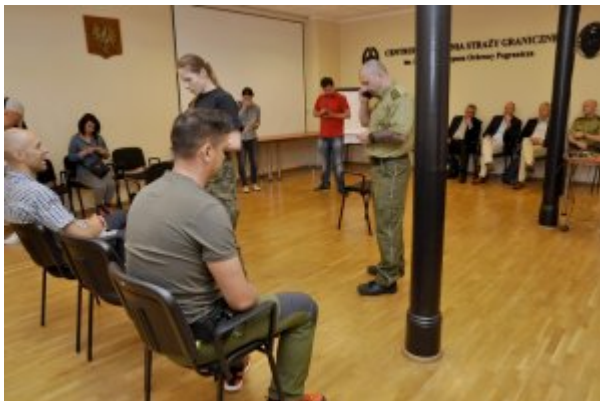
Wizyta przedstawicieli Holenderskiej Żandarmerii Królewskiej