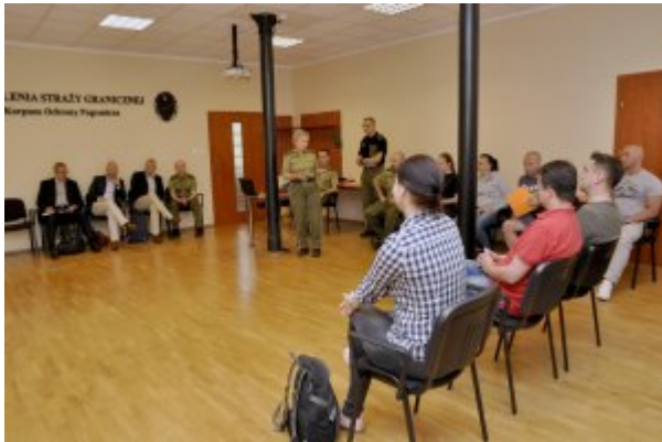
Wizyta przedstawicieli Holenderskiej Żandarmerii Królewskiej