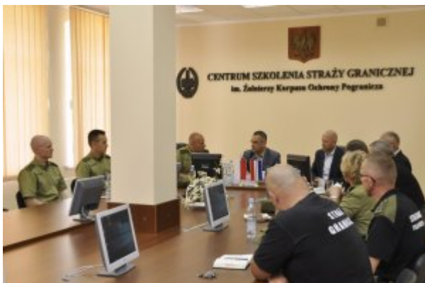
Wizyta przedstawicieli Holenderskiej Żandarmerii Królewskiej