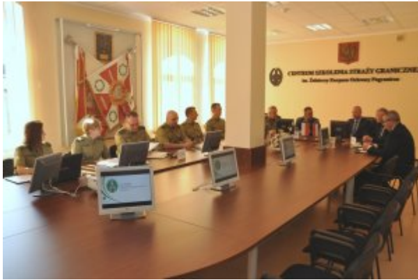
Wizyta przedstawicieli Holenderskiej Żandarmerii Królewskiej